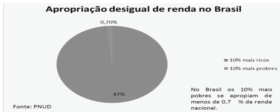
Gráfico 2 - A distribuição de renda do Brasil