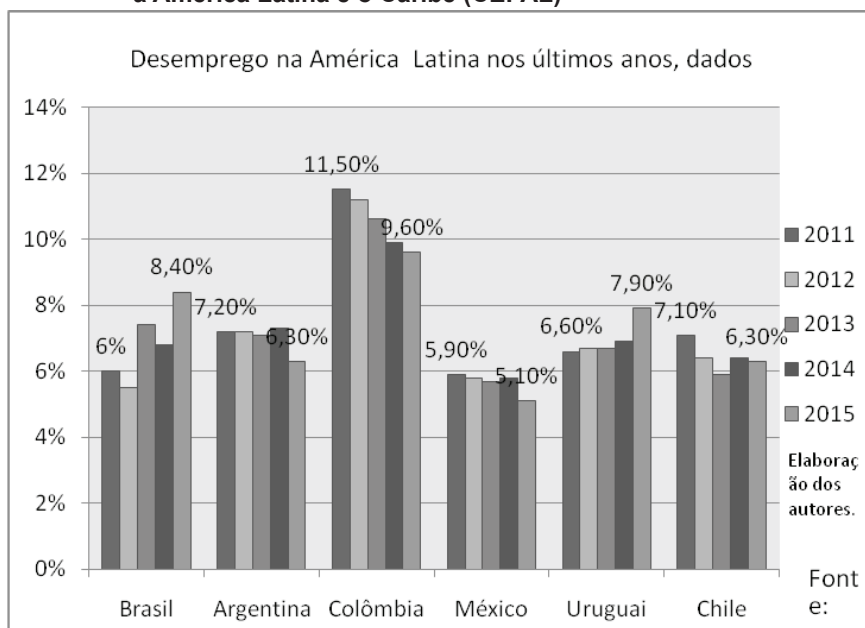
Gráfico 3 - Taxa de desemprego nos países de América Latina, segundo a Comissão Econômica para a América Latina e o Caribe (CEPAL)

Fonte: PONTES. CEPAL divulga relatório sobre economia da América Latina e do Caribe. Geneva: International Centre for Trade and Sustainable Development, 2006. Disponível em: < http://www.ictsd.org/bridges-news/pontes/news/cepal-divulga-relat%C3%B3rio-sobre-economia-da-am%C3%A9rica-latina-e-do-caribe >. Acesso em: 2 jul. 2014.