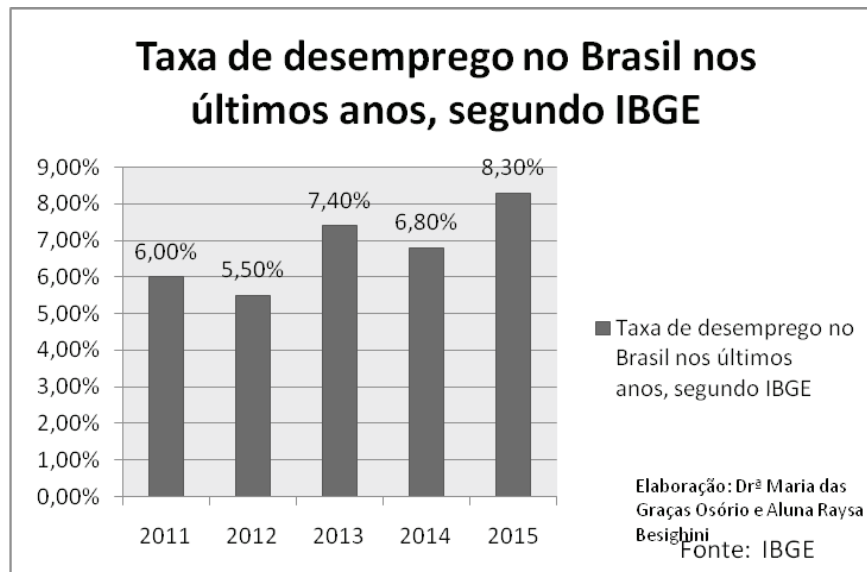
Gráfico 4 - Taxas de desemprego no Brasil