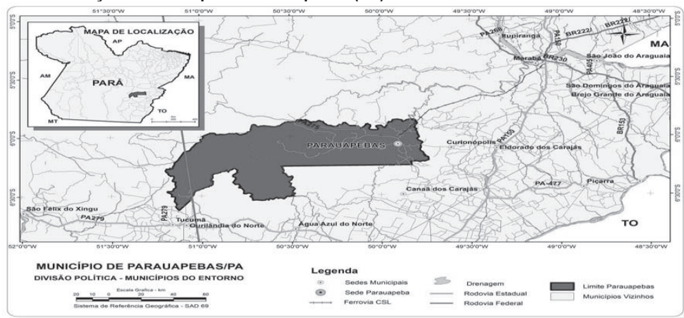
Figura 1 - Localização do Município de Parauapebas (PA)