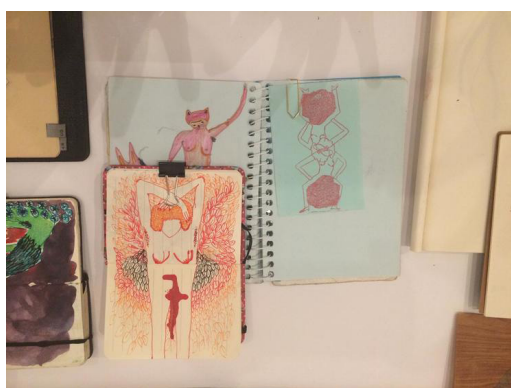
FIGS. 2 e 3: Parte do trabalho da artista que seria exposto na mostra. Em seguida, um dos desenhos que teria sido “escondido”.

Questões de gênero e desconstruções conceituais relativas ao corpo, considerado símbolo de resistência, figuraram visual-