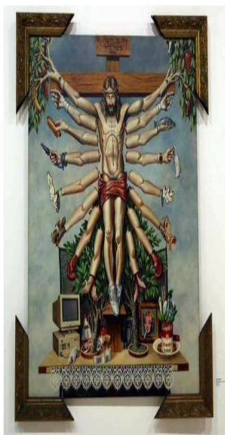
FIGS. 4, 5 e 6: Em sentido horário (6, 5 e 4), um dos quadros com elementos religiosos católicos em fusão com outros símbolos e objetos; obra de Bia Leite que suscitou a discussão a respeito de prostituição infantil, levantada por grupos opositores; e o saguão da exposição no espaço cultural da instituição.

A coletiva que foi inaugurada em 15 de agosto de 2017 ficaria em cartaz até 08 de outubro. No entanto, fora encerrada em 10 de setembro do mesmo ano. A mostra com temática de diversidade sexual teve uma repercussão midiática mais ampla e capilarizada do que a exposição anteriormente analisada por ter inaugurado – pelo menos no discurso referendado pelos canais de comunicação de maior alcance nacional – os casos de obstrução das possibilidades de expor livremente trabalhos artísticos no Brasil, em especial no ano de 2017. Devido a sua temática, o debate tornou-se intenso e muitas questões foram problematizadas, nesse momento em que a grande mídia di-