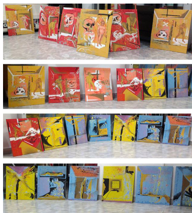
FIGS. 7 e 8: Parte dos quadros que compuseram a exposição Cadafalso da artista mineira Alessandra Cunha (Ropre).

A polícia chegou a apreender um dos quadros, em setembro de 2017, para averiguar se, de fato, fazia apologia à pedofilia 6 ,