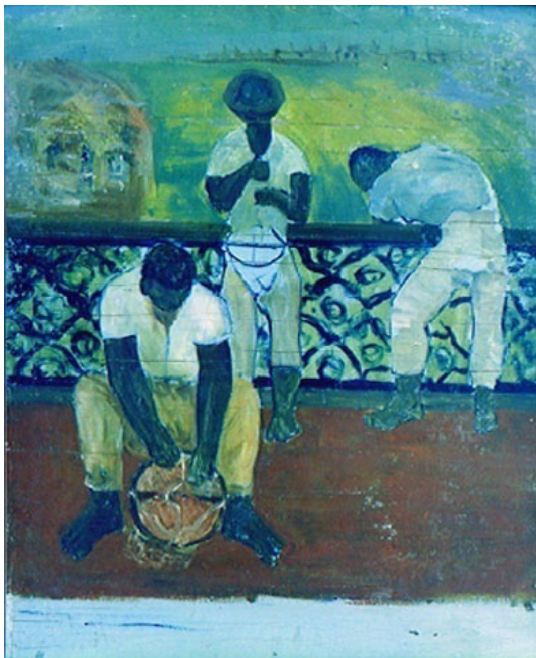
Figura 1 – Gilvan Samico. Pescadores de Siri na Ponte Velha. 1952. Óleo sobre hardboard. 71 x 59 cm.