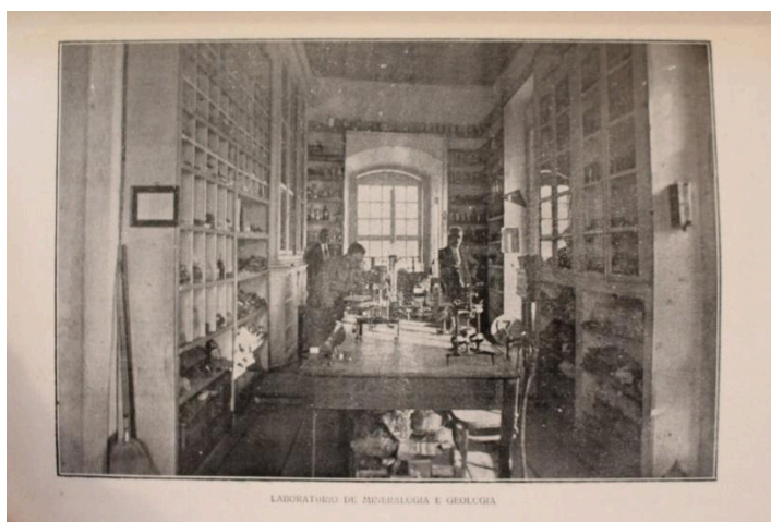
Figura 1: Laboratório de Mineralogia e Geologia da EMOP

Na Figura 1 pode-se observar a formação do laboratório de Mineralogia já nas primeiras décadas dos anos de 1900. A imagem retrata a presença de microscópios polarizadores e outros instrumentos adquiridos para o funcionamento do espaço. Ademais, é possível identificar o mobiliário em madeira, cuja estética se aproxima dos museus de história natural do século XIX. Todo o espaço rodeado por nichos, gavetas e estantes servia para receber as amostras mineralógicas, os produtos químicos e os materiais necessários para os testes e experimentos.