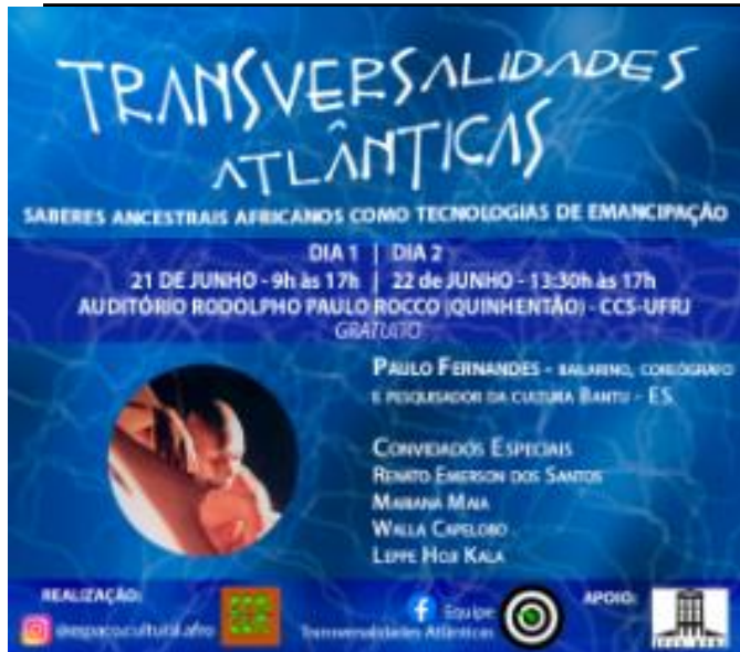
Imagem 02 - Arte de Divulgação da primeira edição do projeto “Transversalidades Atlânticas: Saberes ancestrais africanos como tecnologias de emancipação”, 2022.