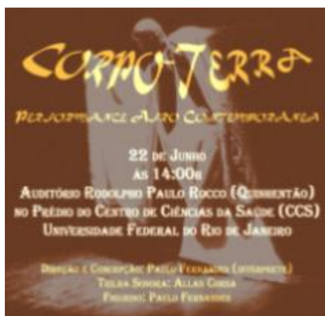
Imagem 03 - Arte de divulgação da performance “Corpo-Terra”, 2022