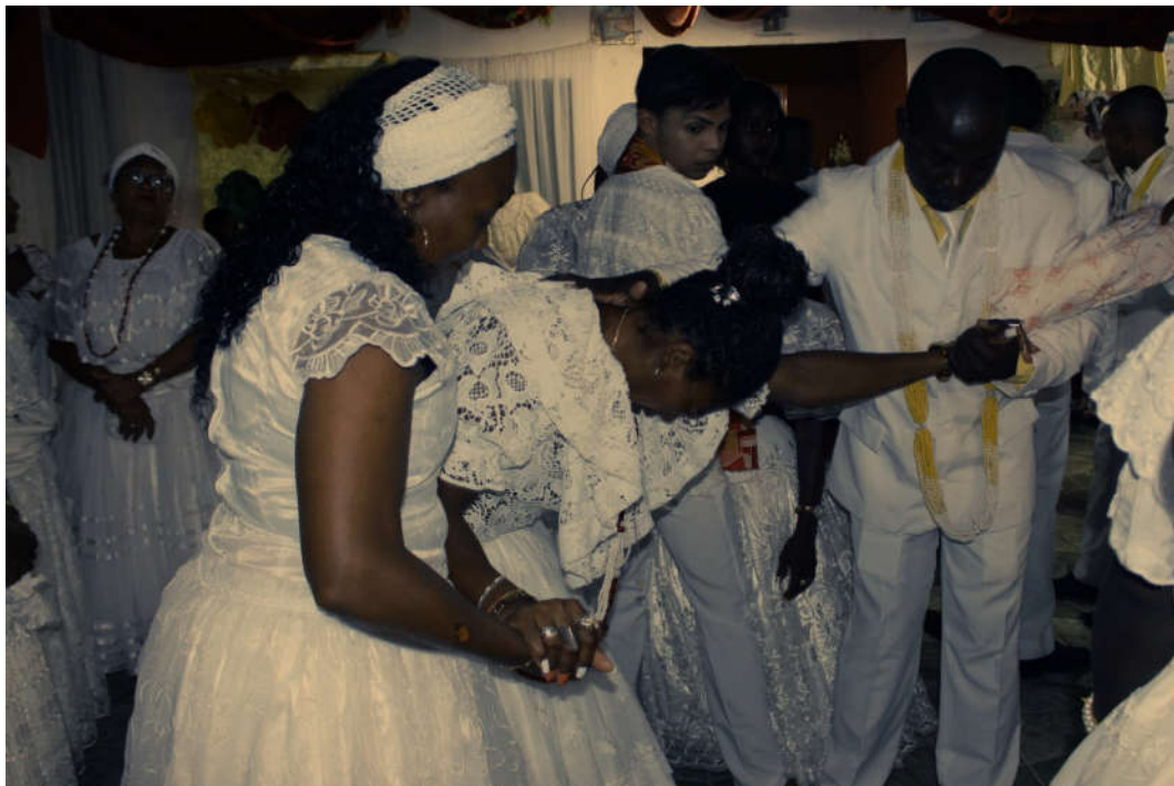
O sagrado é intenso e o humano frágil