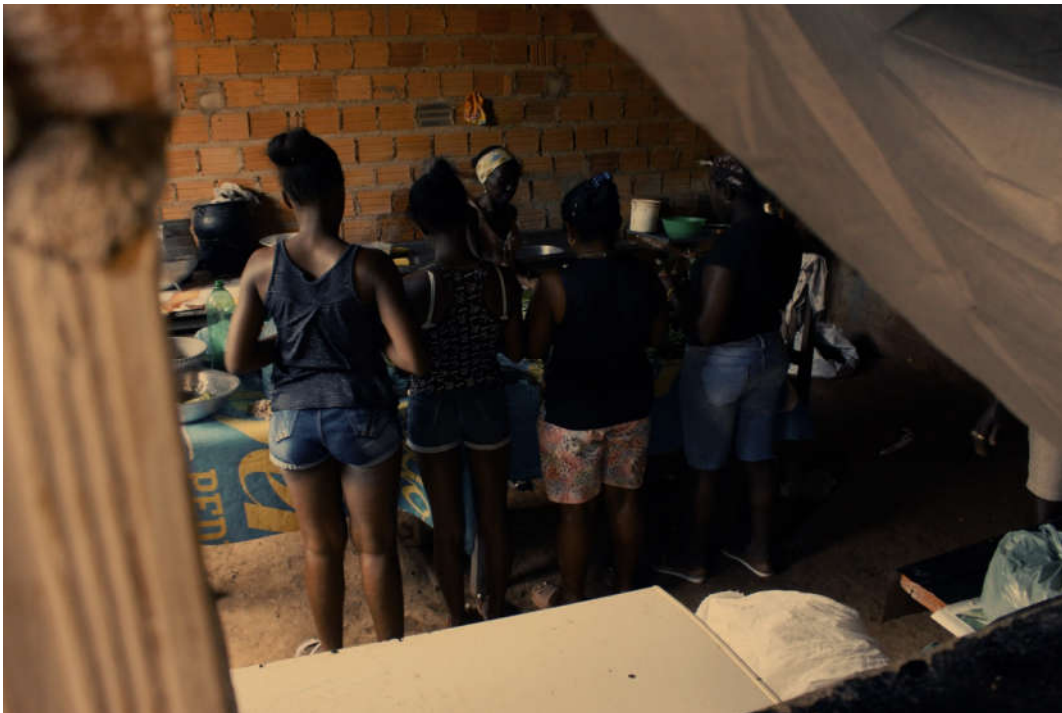
Mulheres preparam a refeição que será servida antes do ritual