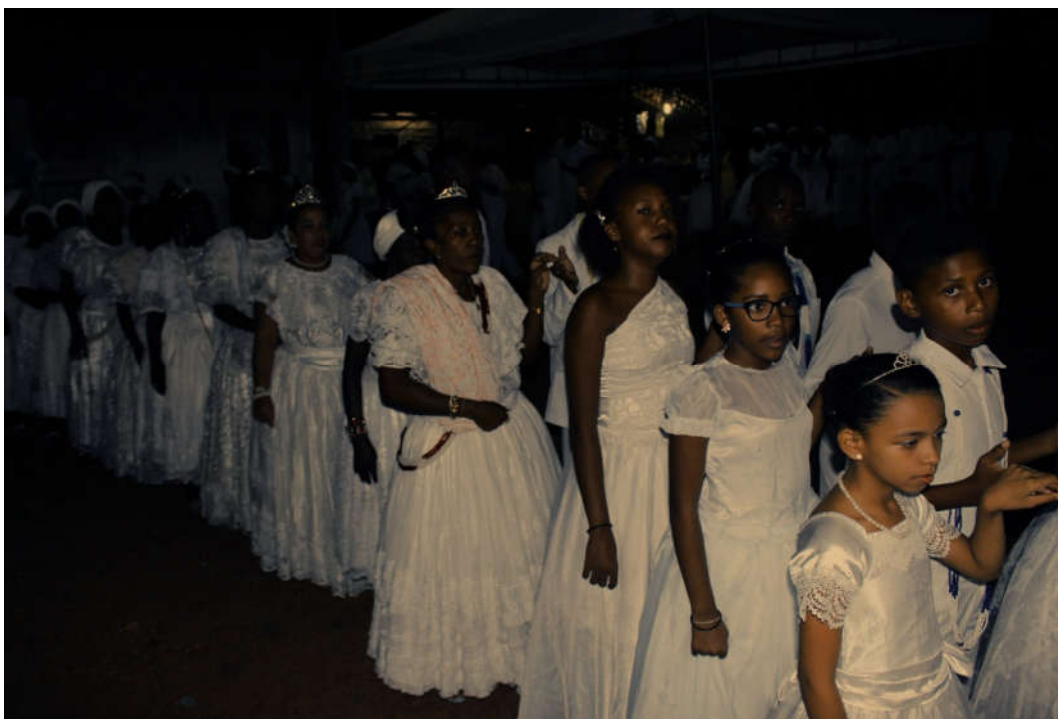
Adeptos da Umbanda aguardam o início do ritual