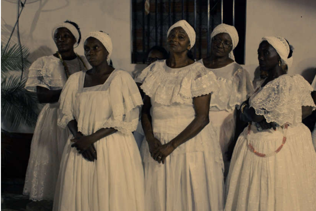
Na tenda a presença de mulheres prevalece