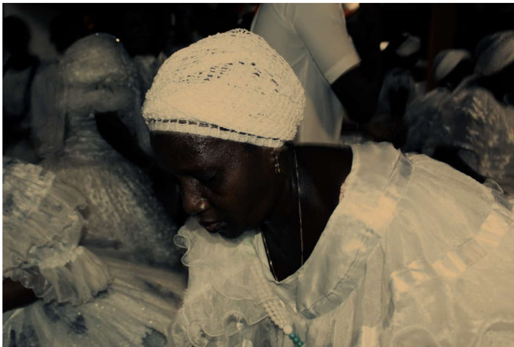
Os movimentos são intensos, regidos pela cadência dos tambores