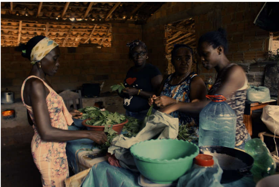
Mulheres preparam o cuxá, prato típico do Maranhão