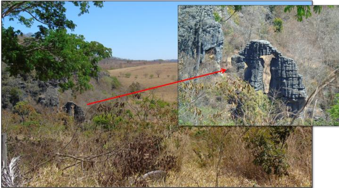
Figura 2 – Vista do Maciço do Baú e em detalhe a geoforma que dá nome ao maciço

Na área de mineração desativada da Finacal realizamos a quarta parada. O carste é constituído de rochas carbonáticas (calcário e dolomita), as quais servem de matéria-prima para indústrias de construção civil e indústrias agrícolas, dentre outras. Tal uso econômico/comercial torna essas áreas muito vulneráveis à exploração mineral, conforme se observou no local visitado, onde os cortes nos afloramentos carbonáticos gerados pela atividade da mineração expunham o epicarste. Além disso, pode-se verificar em vários blocos de rochas a presença da calcita, pois se trata de uma área em que este mineral era bem abundante e por isso fora muito explorado (Figura 3).