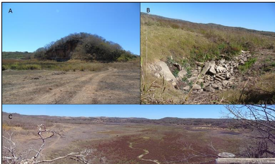
Figura 1 – Maciço do Sumidouro visto do Poljé (A); Sumidouro próximo à área de formação da lagoa (B); Vista da Lagoa do Sumidouro no período seco a partir do Mirante do Sumidouro.

decomposição, não deixando nenhuma dúvida sobre a coexistência desses indivíduos no mesmo período, o que contestou a Teoria Criacionista na época.