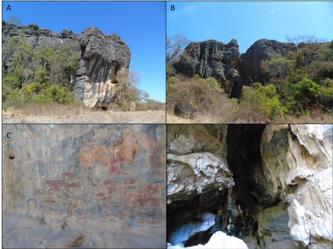
Figura 5 – Vista externa do Maciço da Cerca Grande (A e B); Parte do painel de pinturas rupestres (C); Caverna do maciço com espeleotemas (D).