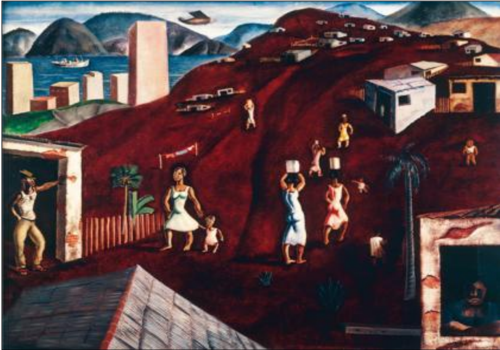
Figura 4 – Morro - Candido Portinari - 1933. Óleo s/ madeira (114 x 146 cm).