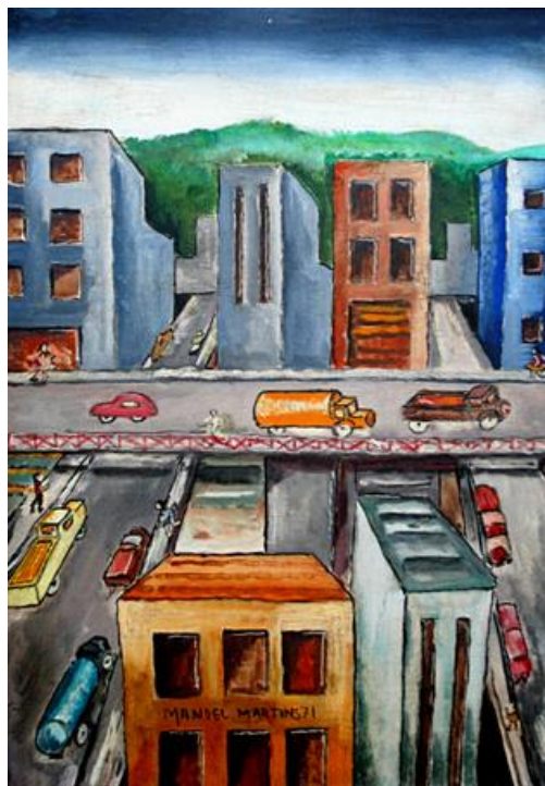
Figura 5 – Cidade - Manoel Martins - 1971. Óleo sobre tela (46.5 x 33 cm). Fonte: Série: Cidade

Os quadros (Figuras 2, 3, 4 e 5) e os poemas previamente selecionados foram impressos em papel A4 com as devidas referências de local e acervo, data da obra, características da pintura, tamanho e um breve histórico do pintor.