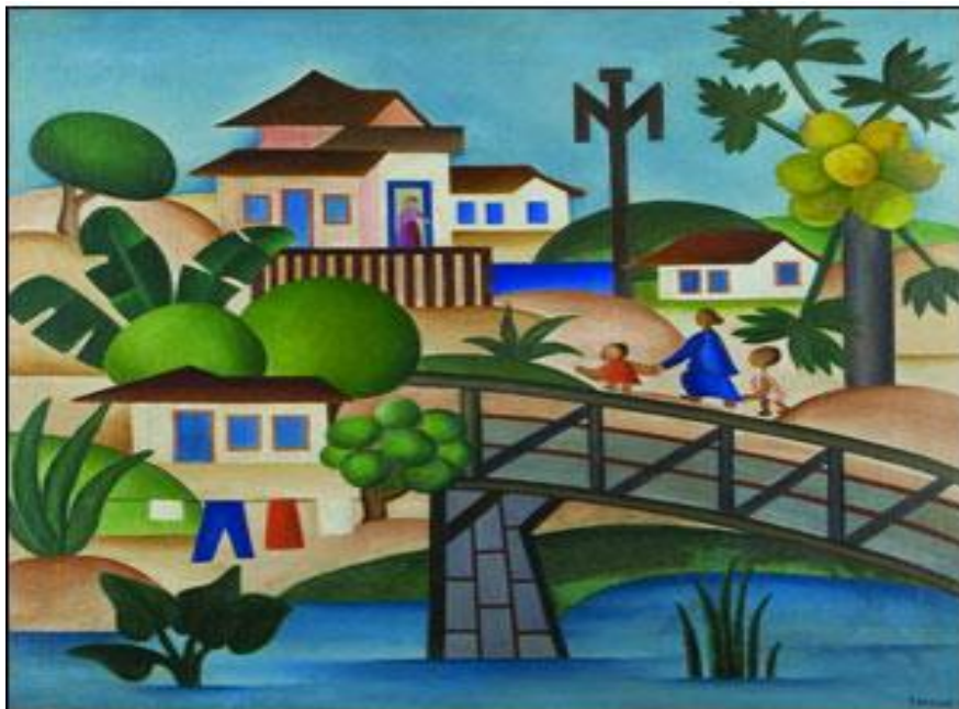
Figura 2 – O Mameoeiro - Tarsila do Amaral - 1925. Óleo sobre tela (65 x 70 cm).

Somadas aos poemas, as pinturas (Figuras 2, 3, 4 e 5) permitiram um trabalho que primou desde o início à interlocução da Geografia com outras formas de ver, pensar e expressar a cidade. Seguem algumas das imagens utilizadas no projeto e nas oficinas com obras de arte de pintores brasileiros que retrataram a cidade em diferentes épocas e de diferentes maneiras.