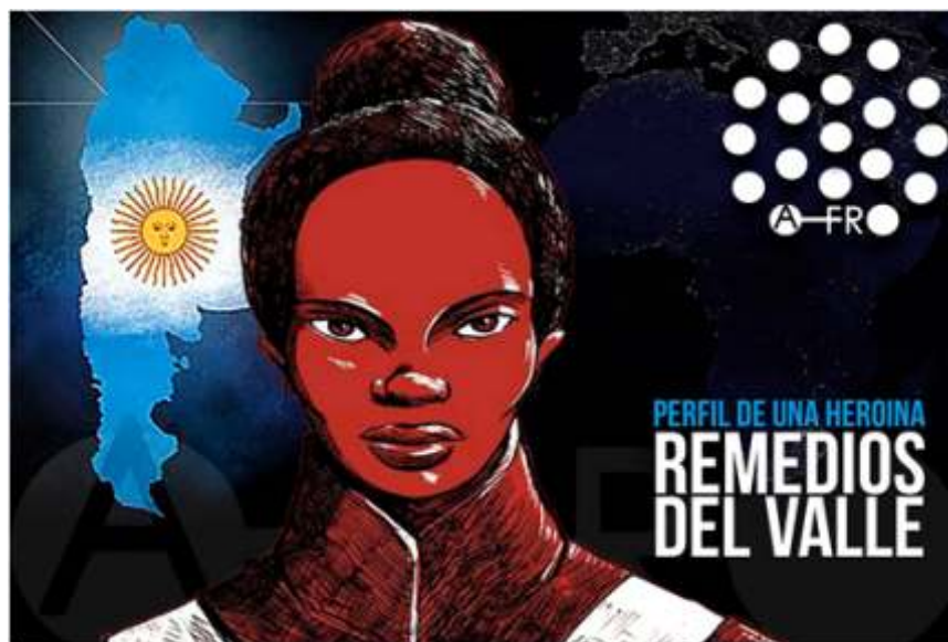
Ilustración para las celebraciones del día 8 de noviembre.

A los argentinos se les gusta decir que sus antepasados vinieron en “los barcos” haciendo referencia a los barcos de la inmigración europea. Sin embargo, es importante traer a la escena de la historia nacional la existencia de otros barcos, los barcos de la trata negrera. Sobre los barcos de trata esclavista, cabe destacar que los puertos en el Río de la Plata, incluso lo de Buenos Aires, desde su fundación en 1580, fueron considerados según historiadores del proyecto la Ruta del Esclavo de la UNESCO puertos importantes en la trata negrera. No se sabe exactamente cuántos barcos entraron, puesto que no todos eran registrados ya que muchos barcos ingresaron a esos puertos de manera ilegal. Pero, además esos puertos eran estratégicos en la comercialización de los esclavizados que eran llevados por tierra desde los estados brasileños Rio Grande del Sur y Mato Grosso y también de Uruguay, Bolivia y Paraguay.