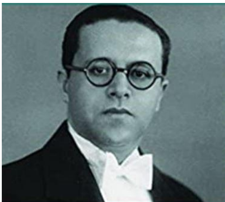
Figura 1 – Theobaldo Miranda Santos

Theobaldo nasceu na cidade de Campos, Rio de Janeiro em 1904, e faleceu em 1971. Formado pela Escola Normal Oficial de Campos, ocupou inúmeros cargos na esfera pública e educacional e, dentre eles, foi professor da cátedra de Prática de Ensino na Universidade do Distrito Federal, assumindo por duas vezes a função de Secretário Geral de Educação e Cultura da Prefeitura do Rio de Janeiro (ROBALLO, 2007).