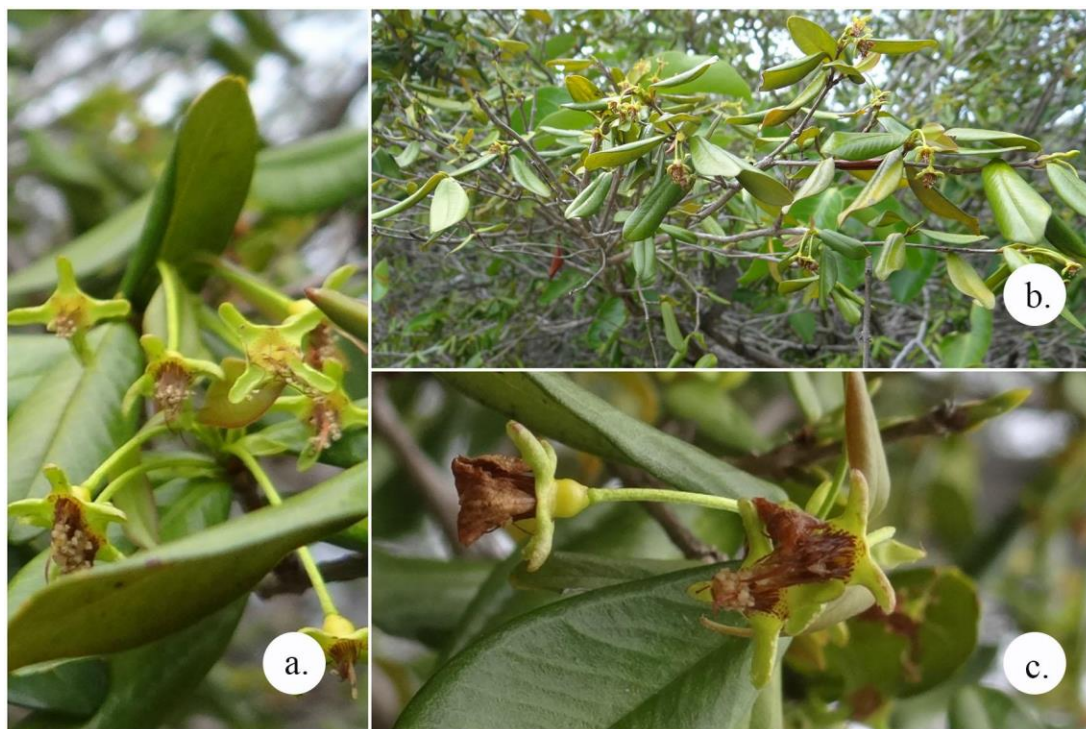
Figura 3 - Eugenia ligustrina encontrada na Ilha Grande do Paulino. a. detalhe da inflorescência. b. hábito arbustivo com folhas conduplicadas c. flor com sépalas deltoides. (Fotos: Correia, B.E.F., 2017).

Eugenia ligustrina assemelha-se morfológicamente a Eugenia azeda Sobral, distinguindo-se pelo comprimento do pecíolo e coloração do fruto (SOBRAL, 2010). Tem semelhança também com Eugenia longipedunculata Nied., diferindo por apresentar catáfilos na base do pedicelo, e a Eugenia sulcata Spring ex Mart., distinguindo-se por apresentar ovário não constricto (COUTINHO et al., 2017). Tem período de floração registrado nos meses de dezembro e janeiro e a frutificação em fevereiro, com frutos de coloração vermelha quando maduros e sépalas persistentes, de coloração vinácea.