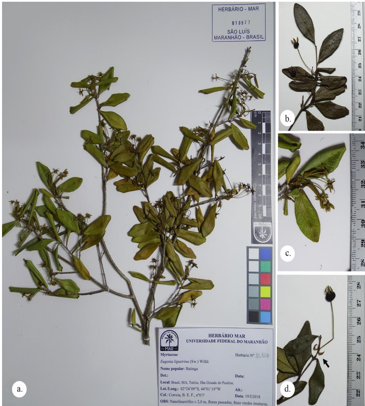
Figura 4 - Exsicata de Eugenia ligustrina incorporada ao acervo do Herbário MAR da UFMA. a. frutos não costados. b. racemos autotélicos. c. catafilos na base da inflorescência (seta). (Amostra: Correia, B.E.F. 877).

Diante desse contexto, a família Myrtaceae é representada no Maranhão por 48 táxons, já incluindo o novo registro de Eugenia ligustrina . Desse total, 20 táxons são pertencentes ao gênero Eugenia ; sendo, portanto, o mais representativo no Estado.