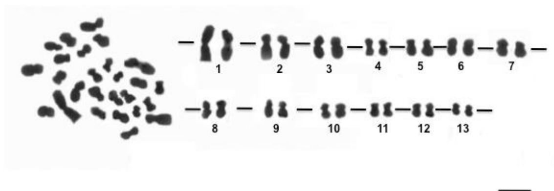
Figura 1. Cariótipo de Cassia fistula 2n = 2x = 26 cromossomos corados com Giemsa 5%. Cromossomos 1, 4, 6, 7, 8, 10, 11, 12 e 13 são metacêntricos e os pares 2, 3, 5 e 9 são submetacêntricos). Barra = 5 \mu m.

Em relação a família Fabaceae as espécies, Senna macranthera e Peltophorum dubium (Biondo et al., 2005) também apresentam 2n=26 cromossomos. Macroptilium martii 2n = 22 cromossomos, Bauhinia cheilantha 2n=28 cromossomos (Bezerra et al., 2008). A variabilidade no número de cromossomos está relacionada à variação intra- e interespecífica e seu conhecimento pode contribuir para uma delimitação taxonômica mais natural de subespécies e de espécies bem como para o reconhecimento de citótipos dentro de populações de uma mesma espécie.