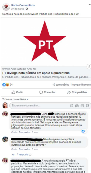
Imagem 2 – Discurso político-partidário nos comentários