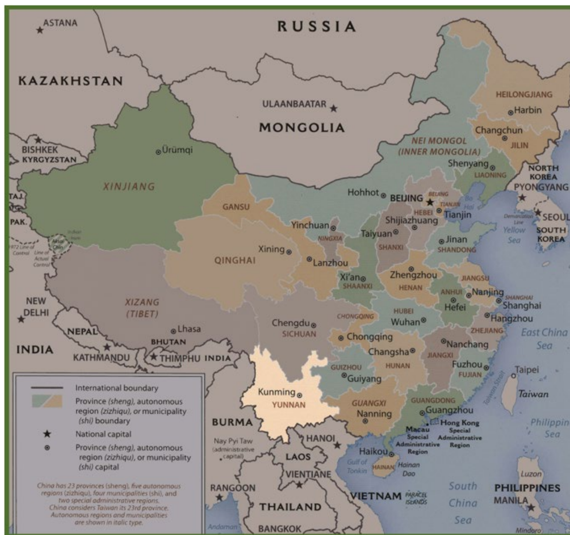
Mapa 1: Localização da província de Yunnan

Em conexão com as recomendações e diretrizes nacionais das quais acabamos de ver alguns aspectos, como uma província chinesa implanta, de acordo com suas particularidades geográficas e históricas, uma estratégia para o entendimento internacional e a IES? Localizada no sul da China (veja o mapa 1 abaixo), a Província de Yunnan, porque estava relativamente distante de uma grande metrópole internacional, experimentou um desenvolvimento econômico e social atrasado se comparado ao nível médio da China. Mais recentemente, com a implementação da política das “Novas Rotas da Seda”, a província de Yunnan tornou-se um centro de abertura para o sul e sudeste da Ásia, usando a sua localização geográfica particular fronteira com esses países, e remobilizando a sua tradição histórica de intercâmbios amigáveis com eles. Aproveitando ao máximo essas vantagens, os governos centrais e provinciais orientam e incentivam as universidades a se internacionalizarem, desenvolvendo políticas de abertura ao mundo exterior, de modo a promover o desenvolvimento contínuo da IES.