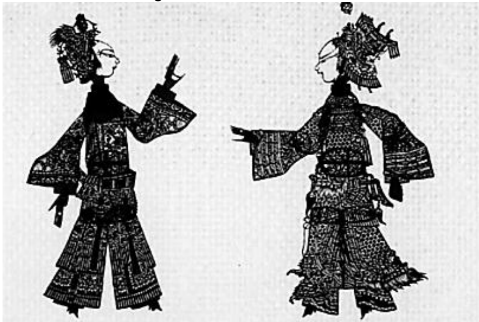
Figura 1 – Teatro das sombras