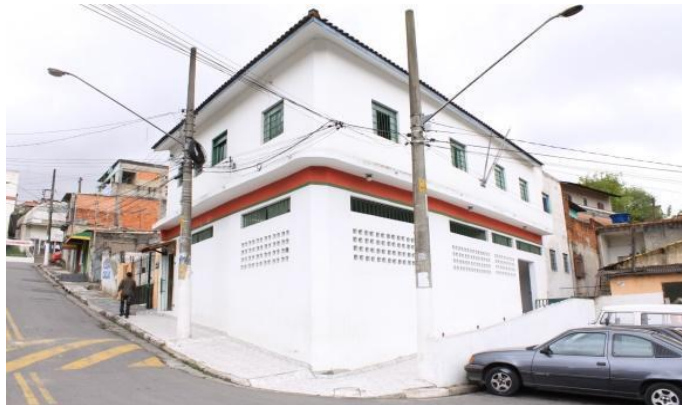
Figura 4 - Fachada da Biblioteca Ramal Heitor Sinegaglia (BRHS)

Nomeada em homenagem ao jornalista, chargista e analista político osasquense Heitor Sinegaglia, a biblioteca está localizada na Praça Sabanta, 98, Olaria do Nino, zona Sul da cidade (Figura 4).