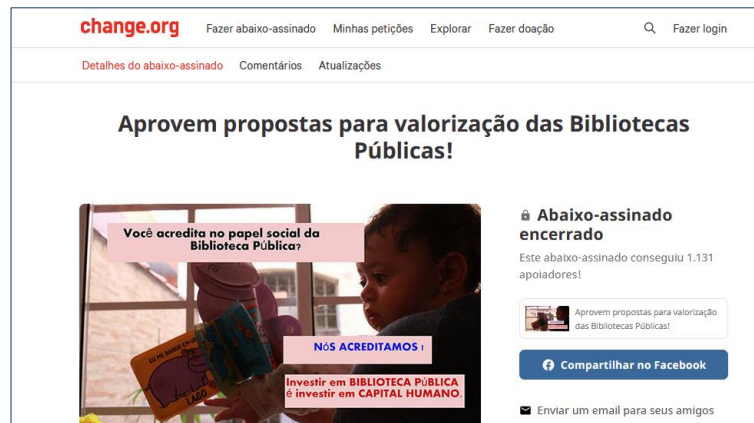
Figura 12 - Reprodução do abaixo-assinado Aprovem propostas para valorização das Bibliotecas Públicas!

Em 2013, diante da situação de desamparo das bibliotecas públicas (BIBMAIS, 2012a), o Coletivo lançou o abaixo-assinado online “Aprovem propostas para valorização das Bibliotecas Públicas!” 6 em apoio às propostas para valorização das Bibliotecas Públicas, elaboradas pelo movimento e focadas na adoção de políticas culturais e criação do Fundo Municipal de Bibliotecas (Figura 12). A iniciativa alcançou 1.131 assinaturas e, juntamente com as propostas, foi encaminhado à organização da 3ª Conferência Estadual de Cultura, realizada nos dias 11 e 12 de setembro de 2013.