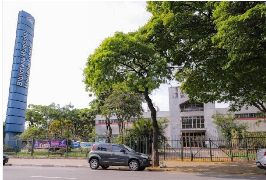
Figura 1 - Fachada da Biblioteca Pública Monteiro Lobato (BPML)