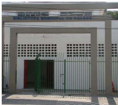
Figura 3 - Fachada da Biblioteca Ramal Manoel Fiorita (BRMF)

Localizada na Avenida Getúlio Vargas, 1634, no bairro Piratininga (Figura 3), a biblioteca foi nomeada em homenagem a Manoel Fiorita, membro do movimento pela emancipação administrativa de Osasco e, posteriormente, vereador no município (OSASCO, 2013).