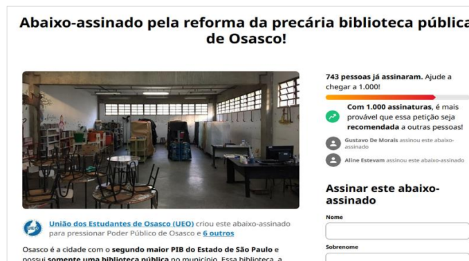
Figura 8 - Reprodução do abaixo-assinado pela reforma da BPML, organizado pela União dos Estudantes de Osasco (UEO)

As duas iniciativas de caráter popular realizadas pelos Movimento em Defesa do Patrimônio Histórico, Artístico e Cultural - MODEPHAC e pelo Movimento Reabre Biblioteca, bem como as iniciativas promovidas pela União dos Estudantes de Osasco - UEO (BOAVENTURA, 2021) e pela Mandata AtivOZ (BIGARDI, 2021) se caracterizam como iniciativas pautadas em ações voltadas para questões pontuais como reforma, readequação e reabertura na Biblioteca Pública Municipal “Monteiro Lobato”, valendo-se, para tanto, de estratégias como: publicação de texto e matérias jornalísticas, realização de abaixo-assinados, criação de perfil em rede social e realização de ato público (Figuras 8, 9 e 10).