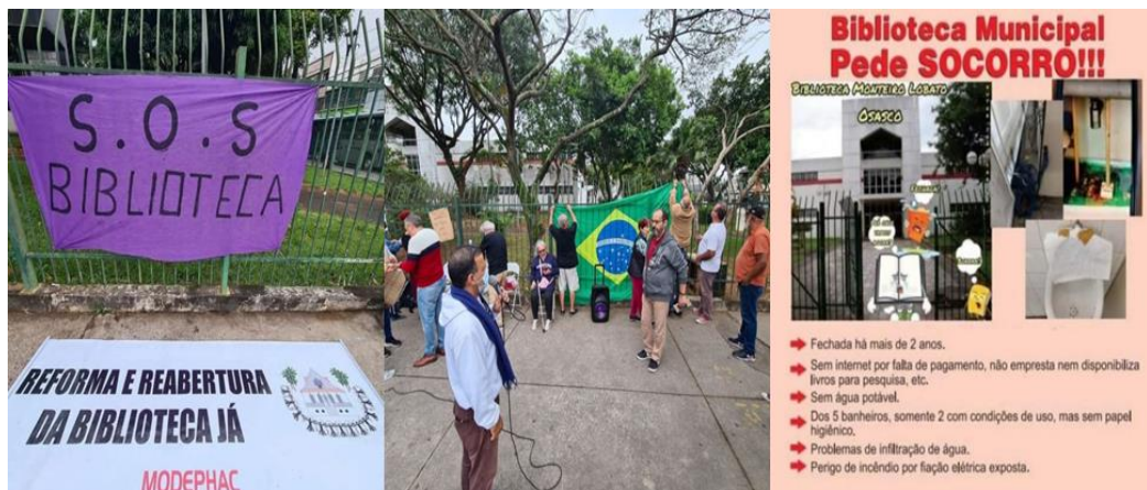
Figura 10 - Ato público em frente à BPML em 30 de abril de 2022, organizado pelo MODEPHAC