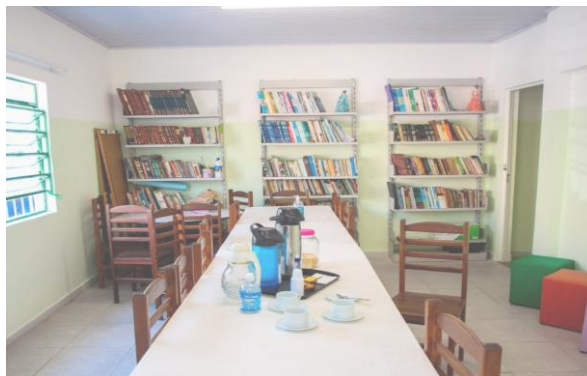
Figura 5 - Área interna da Biblioteca Ramal Ubirajara Coutinho (BRUC)