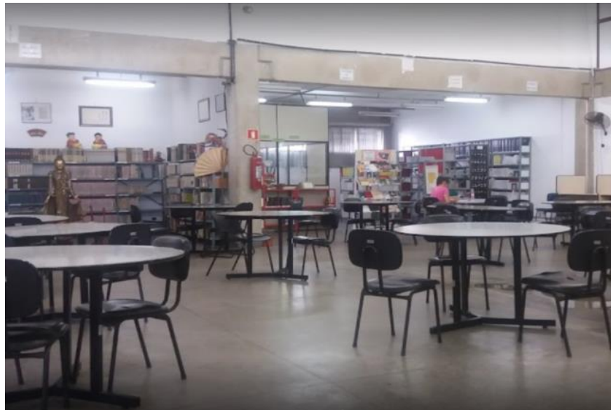
Figura 2 - Sala de leitura da Biblioteca Pública Monteiro Lobato (BPML)