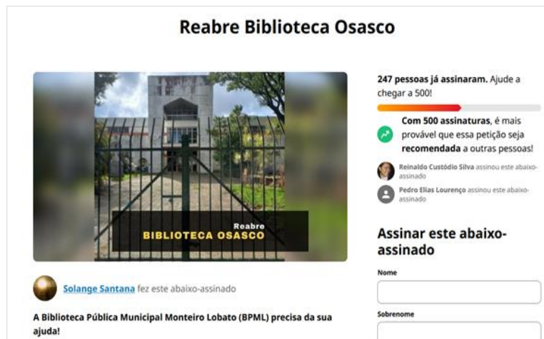
Figura 9 - Reprodução do abaixo-assinado pela reabertura da BPML, organizado pelo Movimento Reabre Biblioteca Osasco