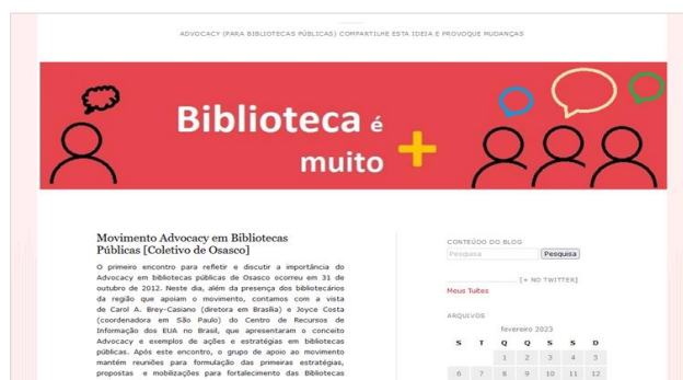
Figura 11 - Página inicial do Blog BIBMAIS ( Biblioteca é muito + )

A criação do Blog Biblioteca é Muito + surgiu do interesse em promover ações de apoio às Bibliotecas Públicas de Osasco, assim como divulgar as atividades promovidas por estas instituições e sua importância para comunidade local. Para isso, adotamos como método de trabalho a proposta de Advocacy em bibliotecas, divulgada pela American Library Association (ALA) [...] Acreditamos que ações públicas devam emergir da sociedade civil organizada, dos profissionais da área da Biblioteconomia/Ciência da Informação e interessados em disseminar o conceito de Biblioteca Pública como espaço criativo de cultura, memória e formação da cidadania, que fortalece o direito inquestionável de acesso à informação por meio de tecnologias e ferramentas de mídias sociais (BIBMAIS, 2012c).