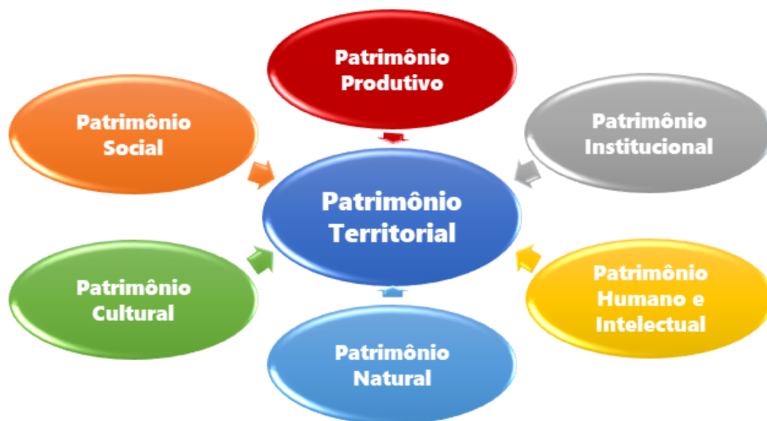
Figura 1- Patrimônio Territorial e seus componentes