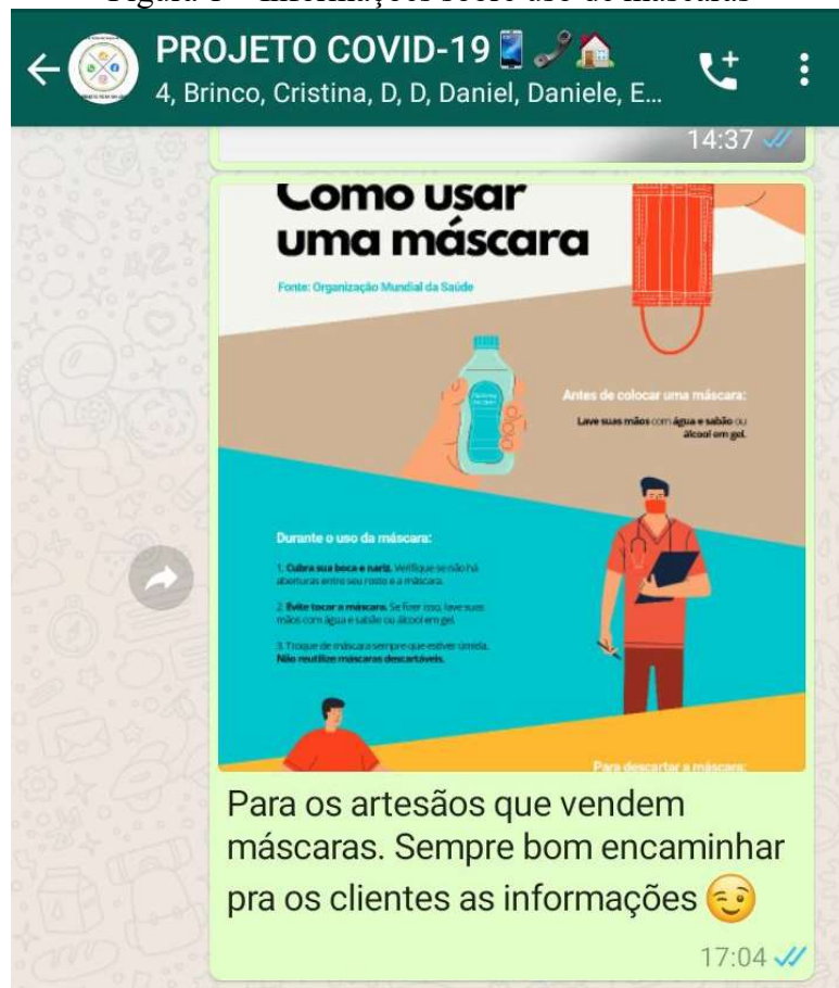
Figura 1 – Informações sobre uso de máscaras