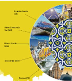
Figura 5 – Site para pequenos empreendedores SEBRAE e Magazine Luiza