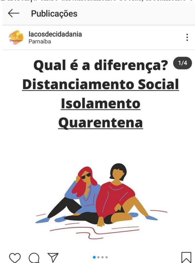
Figura 2 – Diferença entre distanciamento social, isolamento e quarentena