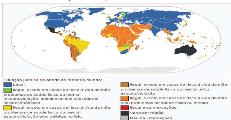
Figura 1 - Situação do aborto no Mundo