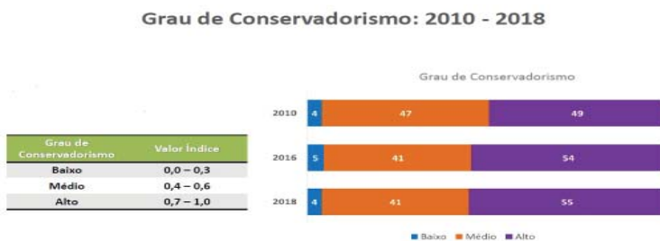
Figura 4 - Grau de conservadorismo no Brasil 2010-2018

O percentual dos entrevistados que disse ser contra o aborto foi o maior percentual observado desde 2010. O nível de conservadorismo também teve pequeno crescimento, classificando o brasileiro como médio conservador, embora muito perto do percentual considerado como conservadorismo alto. O gráfico a seguir compara o nível de conservadorismo no Brasil entre os anos de 2010 a 2018, em percentuais da população: