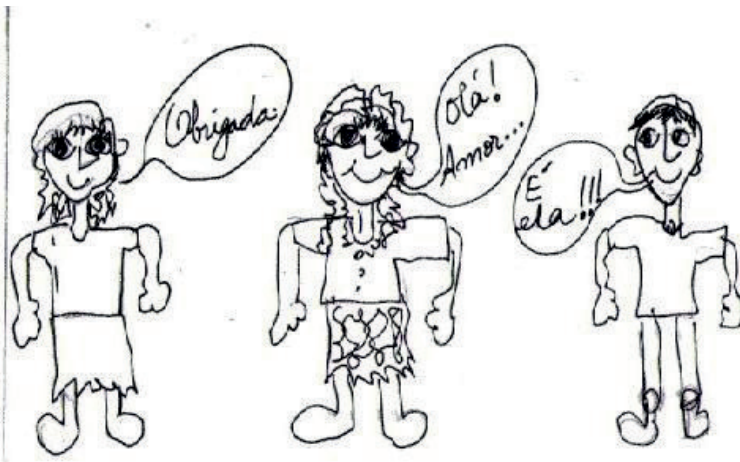
Figura 5. Ilustrações dos alunos sobre a “História da Carolina”

Como atividade transversal a todos os períodos letivos, destacamos a “História da Carolina” 9 , desenvolvida também no ano letivo anterior (Figura 5). Esta atividade visou desenvolver as competências de leitura e de escrita dos alunos, abordando temáticas do seu interesse, que merecem destaque na atualidade e no contexto em que vivem. Tratou-se de uma história aberta, pois vários temas poderiam ser desenvolvidos, permitindo ao professor conhecer a opinião dos alunos sobre o que está sendo discutido de forma lúdica e prazerosa. Os alunos “deram vida” à personagem Carolina e compartilharam com os colegas de turma e professores os seus desejos, medos e necessidades, relacionados, principalmente, com o período da adolescência pelo qual estavam atravessando.