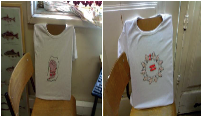
Figura 3. Atividade do Projeto “Marcha pelos direitos humanos”

Ainda numa perspectiva de cidadania planetária e tendo como objetivo uma vida saudável, foram desenvolvidas atividades nas quais os alunos tiveram a oportunidade de refletir sobre a importância da preservação ambiental e sobre alguns dos problemas mais comuns que afetam o meio ambiente. Por sua vez, numa perspectiva micro, os alunos foram envolvidos em ações de melhoria da escola, mais especificamente debatendo em assembleia de turma os problemas da cantina. Os alunos registaram em ata os assuntos discutidos na reunião e as soluções propostas, o que serviu de base para a elaboração de um relatório destinado à direção da escola no sentido de resolver os problemas identificados.