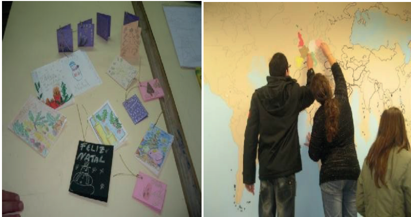
Figura 2. Atividades dos projetos “O Natal no Mundo” “Arte no Mundo” e “Conhecer o Mundo”

Os alunos tiveram participação ativa na definição das atividades relativas aos projetos didáticos supracitados, sendo as suas sugestões analisadas pelos próprios pares e pelo Conselho de Turma, de maneira a decidirem colaborativamente sobre a sua pertinência. Neste contexto, podemos destacar a atividade de planeamento da festa de Natal, na qual os educandos sugeriram e decidiram com os professores o produto das atividades realizadas no período: músicas natalícias em outras línguas, uma peça de Natal e apresentação musical com cavaquinhos. Os encarregados de educação foram presenteados com quadros elaborados e pintados pelos alunos, inspirados nas técnicas de pintores estudados no projeto “Arte no mundo”. O referido trabalho foi acompanhado pela construção do e-portfólio individual onde cada aluno registou as aprendizagens realizadas.