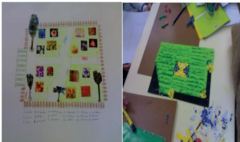
Figura 4. Atividade do projeto “Jardim”

envolvidos na elaboração de um projeto de reforma do jardim da escola. Um profissional especialista na área ministrou uma palestra sobre o assunto, esclarecendo algumas dúvidas e abordando a importância da profissão de jardineiro no contexto atual e as suas múltiplas áreas de atuação. Assim, a partir do trabalho interdisciplinar envolvendo principalmente Matemática, Ciências da Natureza, Expressões Artísticas, Inglês e Espanhol, os alunos planejaram e construíram uma maquete do jardim, cujos critérios de avaliação, e a avaliação propriamente dita, foram por eles realizados com a mediação da DT (Figura 4). As disciplinas Espanhol e Inglês foram fundamentais para que os alunos elaborassem a legenda da planta e da maquete nestas línguas.