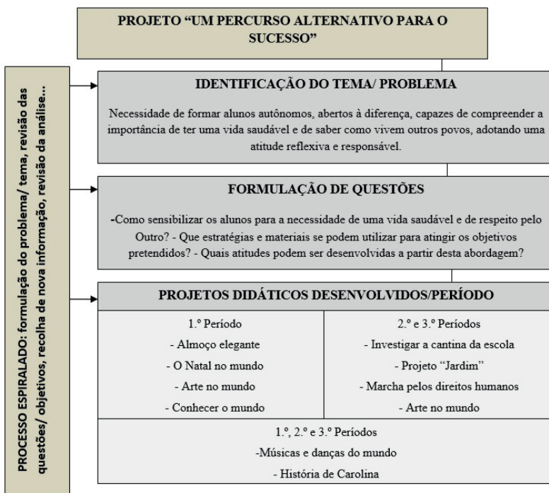
Figura 1. Linhas de Desenvolvimento do Projeto PAS

Na Figura 1, apresentamos uma síntese das linhas de desenvolvimento do Projeto PAS através dos seus objetivos, projetos didáticos e as estratégias didáticas/investigação-ação no ano letivo em questão.