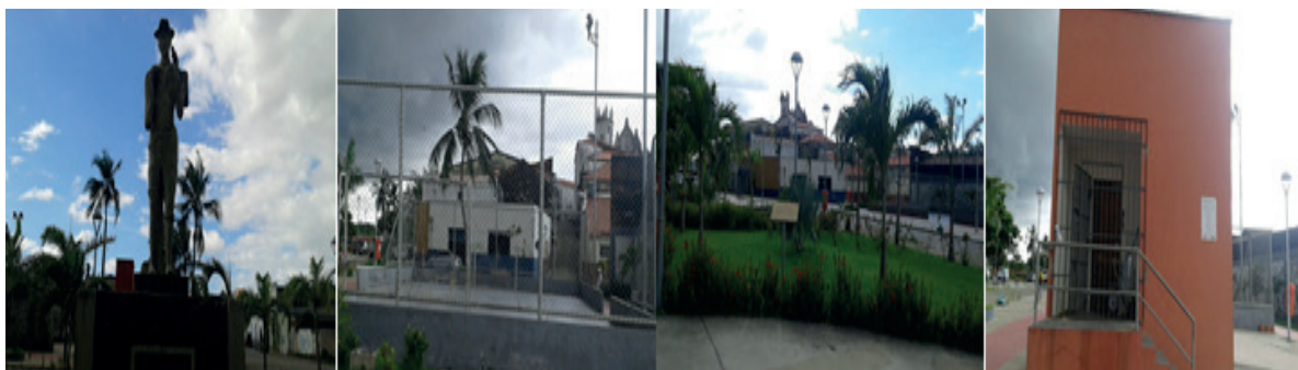
Imagem 01 - Praça do Pescador, localizado no Centro Histórico de São Luís (MA).