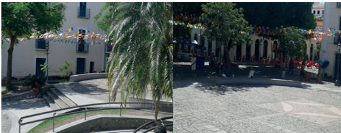
Imagem 02 - Praça Nauro Machado, localizado no Centro Histórico de São Luís (MA).

O segundo local de amostra foi a Praça Nauro Machado, considerada a principal praça do Projeto Reviver, por localizar-se no centro do Patrimônio Histórico e Cultural, local repleto de vários casarões, bares, restaurante e museus. Foi construída no local onde funcionavam antigos galpões de armazenamento de açúcar. Seu nome homenageia o escritor maranhense Nauro Diniz Machado (Ver Imagem 02).