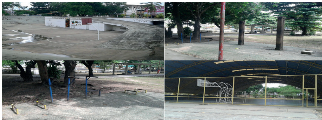
Imagem 03 - Parque do Bom Menino, localizado no Centro Histórico de São Luís (MA).

Durante a pesquisa de campo realizada no Parque Bom Menino, observou-se uma elevada incidência de plantas daninhas, deterioração e depredação dos equipamentos de ginástica e brinquedos.