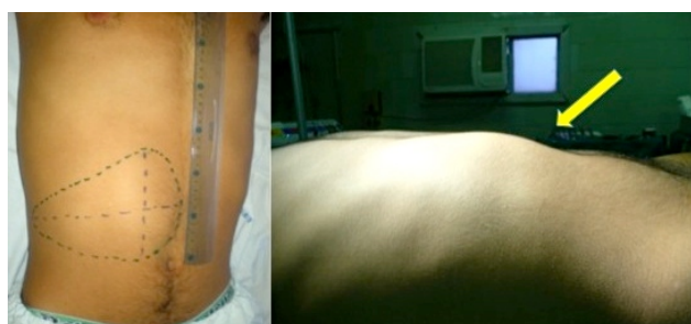
Figura 2 - Dimensionamento das margens tumorais pela ectoscopia e perfil abdominal mostrando o aumento de volume em HD (seta).

com uso de gel massageador. A partir de então apresentou aumento de intensidade e frequência da dor, evoluindo com localização mais definida em regiões lombar superior e hipocôndrio direito, coincidindo com episódios de náuseas vespertinas. Negava vômitos, anorexia, síncope, constipação e diarreia. Ao exame físico apresentava-se em bom estado geral, lúcido e orientado, normocorado, normohidratado, afebril e com diurese mantida. Na avaliação do abdome apresentava massa palpável abdominal de + 12cm de comprimento em seu maior eixo, móvel, de superfície lobulada e dolorosa à palpação, com topografia que parte do flanco direito à meio caminho entre a linha axilar média e anterior dirigindo-se até atingir a linha Alba, margeando todo o gradil costal direito em sua margem superior e tendo sua borda inferior disposta ao nível da linha imaginária que corta transversalmente a cicatriz umbilical, englobando todo o setor do hipocôndrio direito. Ausência de linfonodomegalia, circulação colateral edema de membros e ascite (Figura 2).