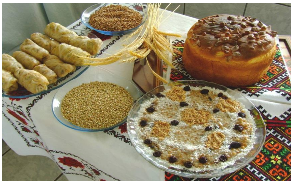
Foto 3 – Pratos típicos da cultura Ucraniana em Prudentópolis (PR).

A culinária ucraniana é bem diversificada, ainda hoje, preservam-se todos os pratos trazidos pelos primeiros imigrantes. Dentre alguns pratos típicos estão o caldo ralo kutyá , preparado com sementes de trigo bem cozidas, mel e sementes de outra planta que se chama mak (papoula). Temos a sopa típica borstch ; canudos (charutos) de repolho – holúbtsi , pastéis recheados com requeijão pirohe e comidos com nata, que são utilizadas em ocasiões especiais como o natal e a páscoa. Além, de serem utilizadas no dia a dia das famílias. Na foto 3 observa-se os detalhes da culinária Ucraniana servida nas famílias e em festas típicas do Município.