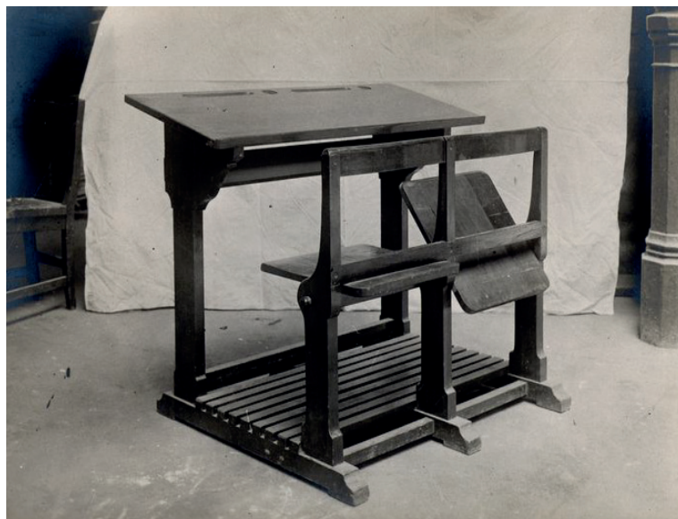
Imagen 5 - El modelo ya propuesto por el Museo Pedagógico Nacional