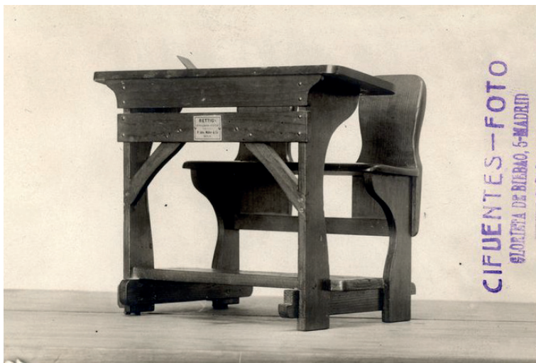
Imagen 2 - El modelo alemán Rettig