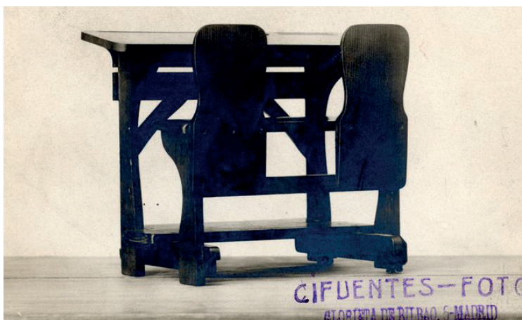
Imagen 3 - El modelo alemán Rettig