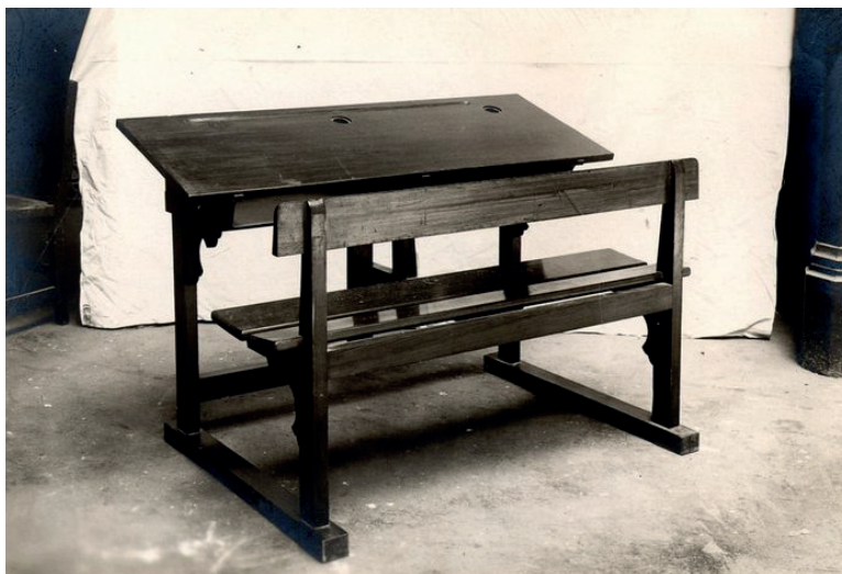
Imagen 4 - El modelo de Paris