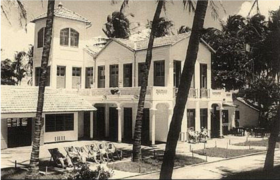
Figura 3 – Casarão da Família Porto (Vila Morena).

hoje se localiza o Estoril, interessante se observar o desprezo que se tinha pelo litoral, ao notar que a arquitetura da cidade dá as costas para o mar. A Figura 3 retrata o ano de 1943, observa-se que a frente do casarão, denominado Vila Morena, está voltada para a Rua dos Tabajaras, prova latente que na época da construção se ignorava o mar.