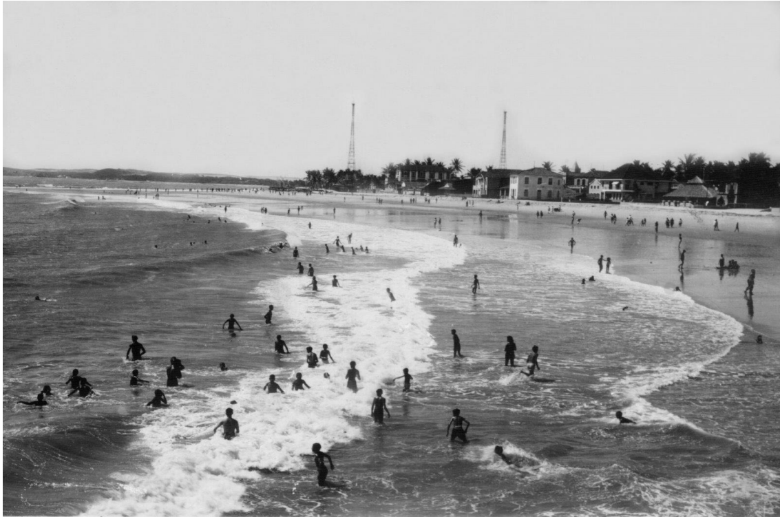
Figura 2 – Praia de Iracema.

Vale lembrar que, anteriormente, o litoral apresentava-se como espaço de habitação das classes de menor poder aquisitivo, mas transforma-se em espaço de construção das primeiras casas de segunda residência 1 , que desterritorializa pescadores dos antigos vilarejos situados nas praias de Iracema e Meireles. Essas comunidades de pescadores podem ser vistas na totalidade do território cearense, por meio delas percebe-se outra forma de ocupação do espaço litorâneo baseado essencialmente na pesca.