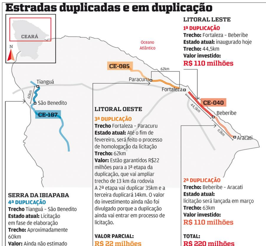
Figura 6 – Estradas duplicadas ou em duplicação no Ceará.

Nota-se que a metropolização turística avança com ajuda da construção e ampliação de vias, caminha-se de forma paralela ao litoral, direcionando-se aos municípios litorâneos. Ao expandir, a metrópole vai além de seus interstícios territoriais, busca-se uso especulativo do solo urbano, processo que também ocorre dentro da RMF. Nota-se que a Metropolização no Nordeste brasileiro, na maioria dos casos, não significa que seja uma complementação ou fragmentação das funções entre os lugares, mas sim um transbordamento das relações sociais da cidade principal para o entorno, a disseminação da vilegiatura e do turismo exemplifica esse quadro (PEREIRA; DANTAS; GOMES, 2016).