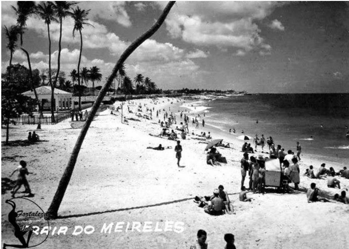
Figura 1 – Praia do Meireles.

Os anos 1920-1930 são marcantes, pois, nesse momento, como se observa na foto, a população fortalezense descobre as práticas marítimas modernas. À medida que estas eclodem, substanciais mudanças podem ser notadas na paisagem litorânea de Fortaleza. Percebem-se dois movimentos característicos no processo de valorização das zonas de praia da capital: o primeiro nos anos 1920-1930 quando se observa a incorporação das zonas de praia como espaço de lazer e veraneio; o segundo ocorre após a década de 1970, com ampliação das práticas marítimas modernas para além do tecido urbano da capital, destaque para o veraneio (DANTAS, 2011). É nesse contexto que Madruga (1991, p. 30) aponta que o desejo de imensidão, de lazer e liberdade conduziu os homens em direção aos litorais como turistas, provocando-os o desejo de instalarem-se em cidades marítimas transformadas pelos hábitos e economia cada vez mais litorâneos. O autor denomina esse processo de “litoralização”, que segundo ele é “a corrida para o mar, ampliando em dimensões o território desta zona, com as ocupações provocadas pela urbanização, pela industrialização e pelo turismo”. Na Figura 2, observa-se o lazer e os banhos de mar realizados na praia de Iracema por volta dos anos 1940.