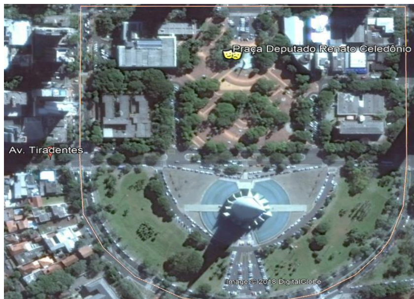
Figura 1 –Praça Deputado Renato Celidônio localizada na Avenida Tiradentes, 2016.

Denominada popularmente como praça da prefeitura, a Praça Deputado Renato Celidônio foi idealizada para ser um espaço de reunião pública e de lazer onde pudessem ser realizadas comemorações cívicas e algumas festividades de caráter cultural, social e beneficente. Trata-se de espaço que dispõe de boa iluminação, uma escultura na parte central, telefones públicos, sanitários, bancos, pavimentação, bebedouro, lixeiras disponibilizadas em vários pontos, estacionamento, além de ser bastante arborizada (BOVO, 2009, p. 174).