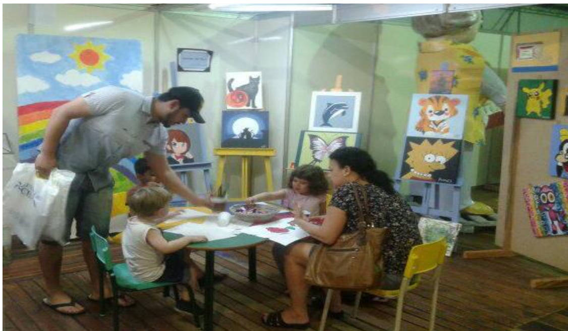
Figura 3 – Espaço criança na FLIM às 20h.

perdurando ao longo do dia e seguindo até às 22 horas, quando se encerram as atividades do dia.