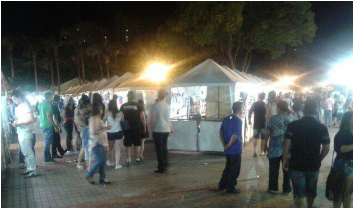
Figura 4 – Barracas de artesanato na Festa dos Estados e das Nações às 20:30h.

A alimentação, além de essencial para a sobrevivência, é uma das opções de várias pessoas quando o assunto é lazer. No caso específico desta festa, ela acaba por unir dois elementos importantes: o sair de sua residência para experimentar o prazer que envolve o saborear pratos diferentes e que fogem muitas vezes do trivial, e, também, a consciência de contribuir para entidades filantrópicas.