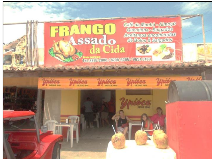
Figura 3 – Ponto/estabelecimento comercial do circuito inferior em frente ao Aquário Natal – 2014

turistas para garantir o sustento de suas famílias. A visita ao aquário é o primeiro ponto de parada do pacote de passeios pelas dunas de Jenipabu, com o período de maior fluxo de turistas entre oito e dez horas da manhã. Após esse horário, o movimento de turistas é quase inexistente, pois, os bugueiros já estão em outros pontos da APAJ.