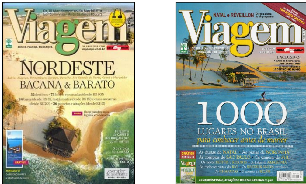
Figura 1 – O Bar 21, entre as praias de Santa Rita e Jenipabu nas capas de uma revista especializada em destino turístico – 2009; 2007