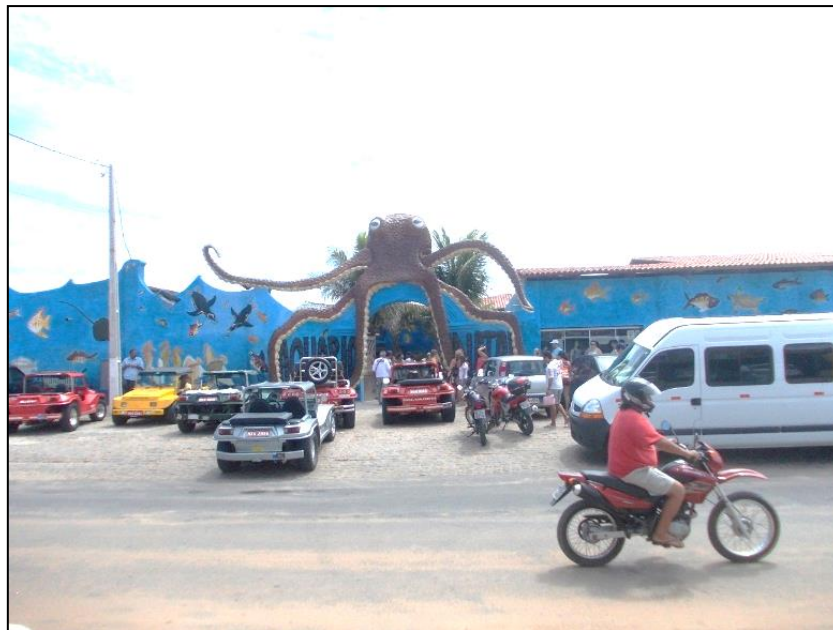
Figura 2 – Aquário de Natal – RN Fonte: Acervo do autor, janeiro de 2014.

Os dois estabelecimentos estão diretamente relacionados com a atividade turística do circuito superior do eixo da vitrine do turismo, tendo como articulador entre essas duas subdivisões do circuito superior os bugueiros. Estes, por sinal, estão diretamente relacionados com o sucesso ou falência das atividades econômicas desenvolvidas na APAJ como um todo.