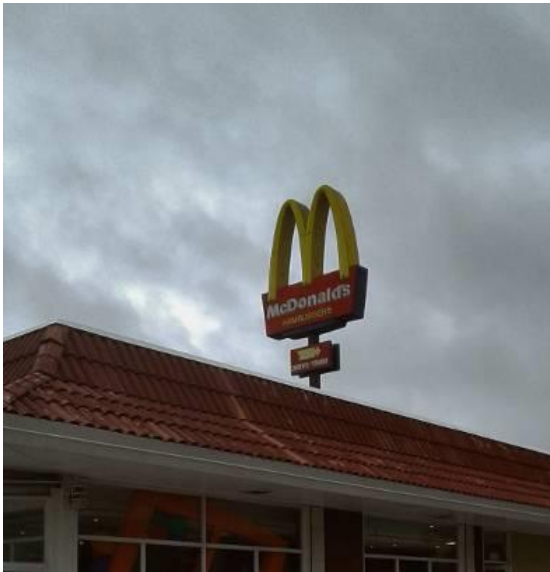
Figura 6 – Torre do McDonald's