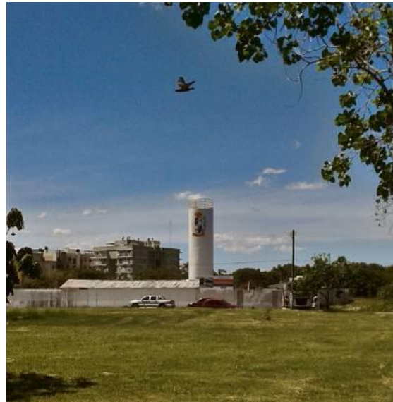
Figura 5 – Caixa d'água

A sua resposta simples e direta me fez pensar numa provável profundidade do que ela conseguia perceber na paisagem. O prédio contrastante tornava-se para ela um marco existente em um dos caminhos para a escola (LYNCH, 1982), mas, além disso, ela parecia fazer a leitura do casarão em níveis que iam além dos valores estéticos (novo, velho, feio, bonito). Para ela, o feio era faltarem com a manutenção, afinal, a casa não se cuida sozinha. Além disso, a manutenção deveria ocorrer para além do deixar o entorno mais ou menos agradável, ou mais ou menos seguro, mas porque o casarão trazia em si os usos passados de outras pessoas.