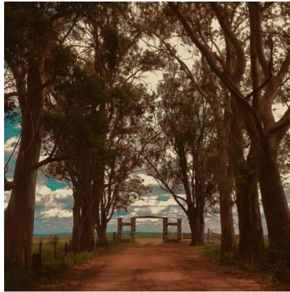
Figura 15 – Estância do Laranjal

A resposta seca, sem qualquer empolgação me pareceu ser resultado da combinação das seguintes razões: (1) talvez eu estivesse projetando a minha empolgação a respeito do lugar sobre eles; (2) desânimo/incômodo por ser horário de almoço; (3) o evento que ocorreria naquele espaço havia sido transferido de última hora para outra parte da cidade, logo, não chegamos a descer do carro e tudo o que observamos foi feito através do veículo em movimento; (4) minhas perguntas durante a visita os distraía da experiência em si, gerando irritação, e (5) a metodologia precisava ser reavaliada. No dia seguinte, retornei minha tentativa de entrevistar a menina, mas novamente a resposta permaneceu inalterada.