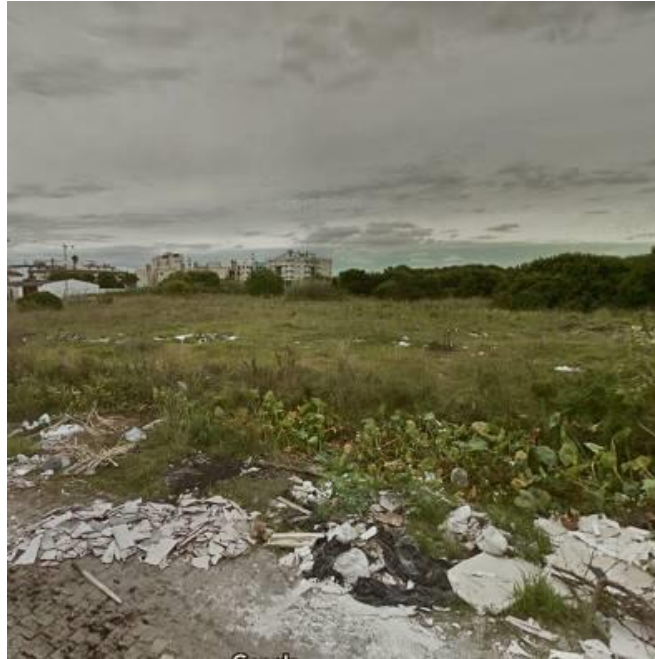
Figura 10 – Terreno em março de 2015