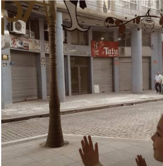
Figura 13 – Café Aquários Fonte: Arquivo pessoal da autora, dezembro de 2015.

rua do café, por exemplo, (e isso também se deve por perceberem o calçamento e os demais prédios que formam a imagem da rua como um todo – Figura 14), imediatamente eles se animam e perguntam se podem ganhar as guloseimas, como de costume.