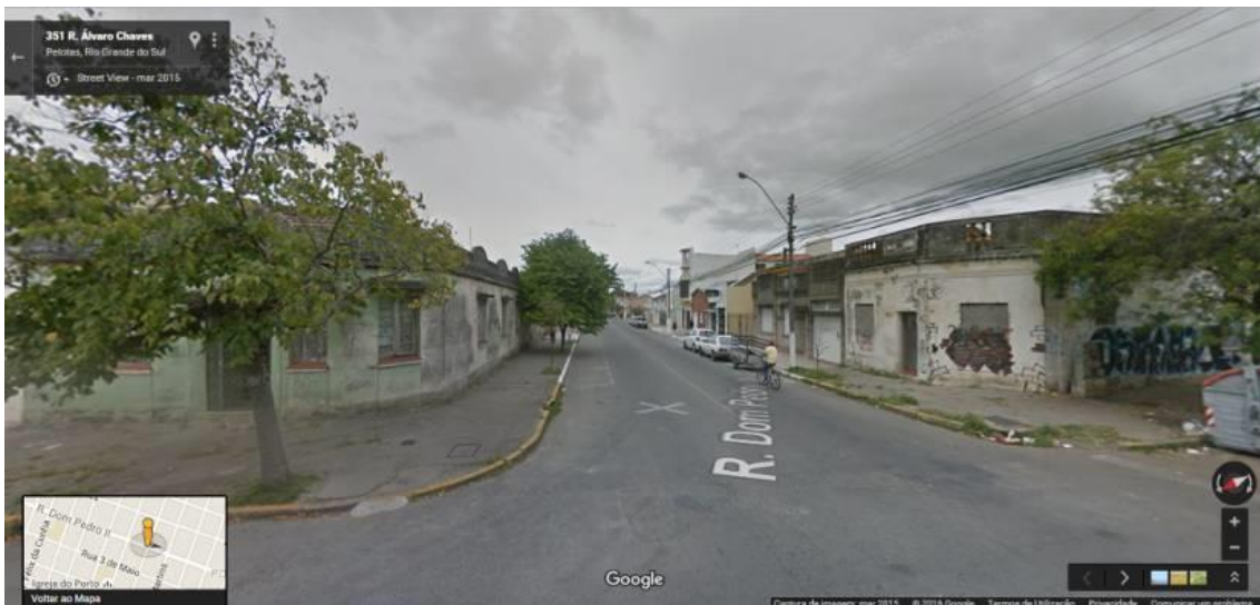
Figura 16 – GMSV

O Google Maps 22 possui três visualizações disponíveis: o desenho de um mapa simplificado; a imagem de satélite como mapa, com detalhes de árvores, prédios, pavimentação; e o Street View , onde é possível navegar “dentro” do mapa, quase como se estivesse caminhando pelas ruas (Figura 16).