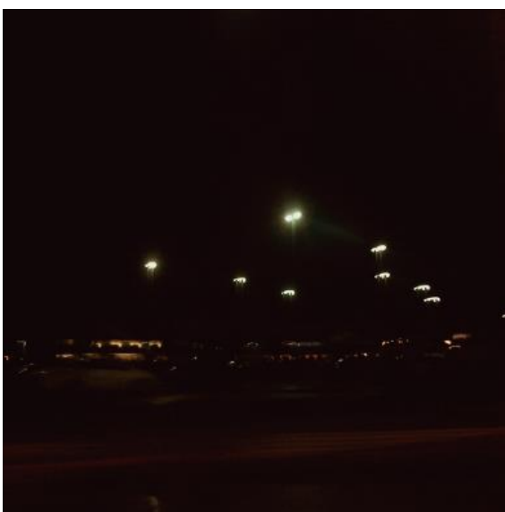
Figura 8 – Luzes brancas do shopping

Os elementos, então, além de demarcarem os lugares favoritos, reforçam a permanência dos mesmos — e dos bens de consumo que eles guardam. Permanência (e consequente sensação de estabilidade e segurança) que pode ser conferida mesmo à noite e à distância. Para uma criança de três anos, que recém aprendeu que os objetos permanecem ainda que saiam do seu campo de visão, olhar pela janela do quarto e avistar de longe as luzes do shopping e o letreiro luminoso do supermercado, lhe causa uma sensação de conforto que precisa ser repetida diariamente.