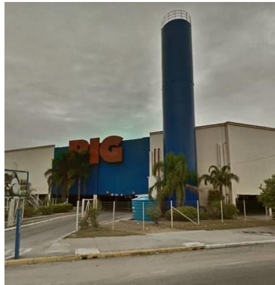
Figura 7 – Letreiro do supermercado Big Fonte: Printscreen GMSV, mar. 2016.

Os elementos, então, além de demarcarem os lugares favoritos, reforçam a permanência dos mesmos — e dos bens de consumo que eles guardam. Permanência (e consequente sensação de estabilidade e segurança) que pode ser conferida mesmo à noite e à distância. Para uma criança de três anos, que recém aprendeu que os objetos permanecem ainda que saiam do seu campo de visão, olhar pela janela do quarto e avistar de longe as luzes do shopping e o letreiro luminoso do supermercado, lhe causa uma sensação de conforto que precisa ser repetida diariamente.