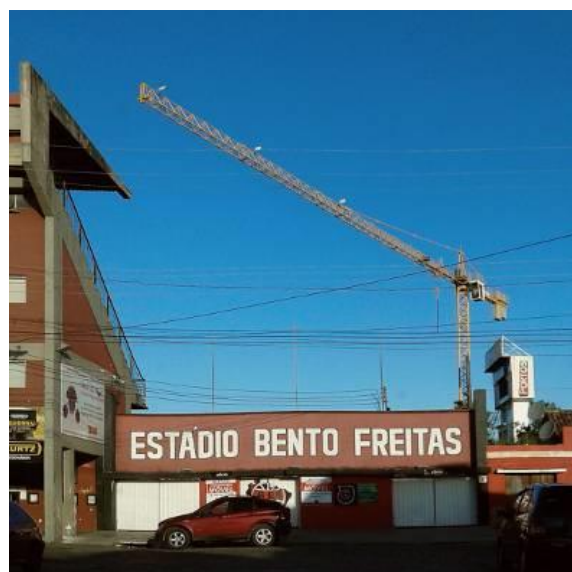
Figura 9 – Torre do Xavante