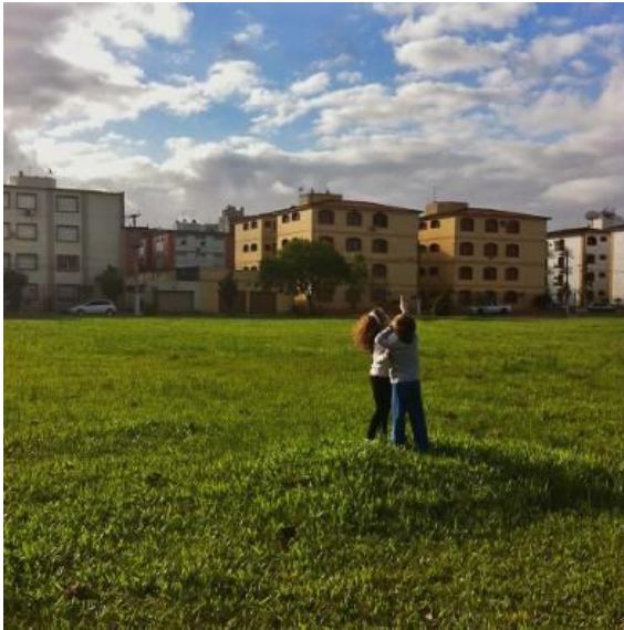
Figura 2 – A montanha do campinho Fonte: Arquivo pessoal da autora, out. 2015.