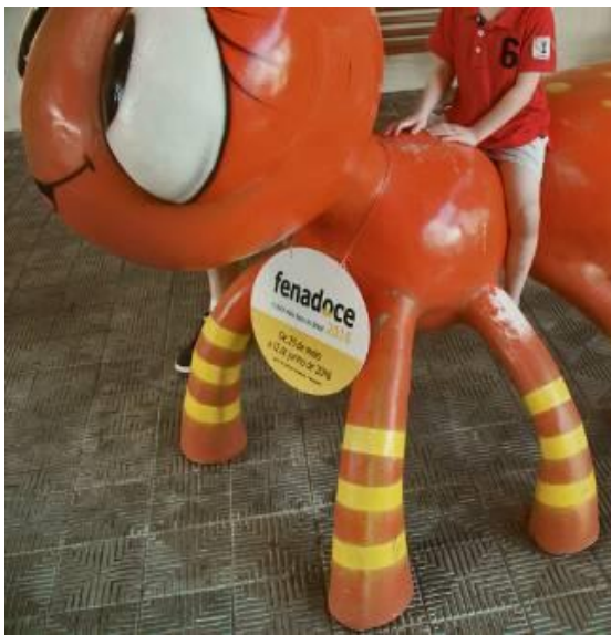
Figura 11 – Formiga do Mercado Central