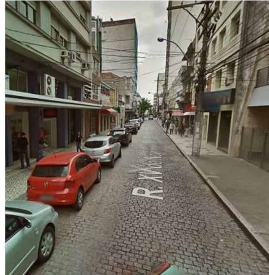
Figura 14 – A imagem da rua

Uma vez no lugar, os laços são fortalecidos quando realizam o consumo. A fachada não é tão importante quanto o interior do prédio – que é identificado pelos seus produtos.