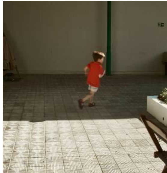
Figura 12 – Espaços vazios do Mercado Central