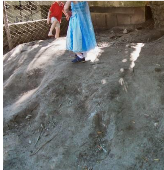
Figura 3 – A montanha da praça

Na Praça Coronel Pedro Osório 7 , ao contrário, existe uma área reservada para as crianças (além de urbanização com bancos, passeios, iluminação, chafariz, jardinagem), e periodicamente eles frequentam esse espaço. No entanto, ainda que possam aproveitar os brinquedos do parquinho, eles e outras crianças, repetidas vezes, preferem uma elevação de terra localizada próxima ao banheiro público e a uma árvore que protege a guarita da guarda municipal (Figura 3).