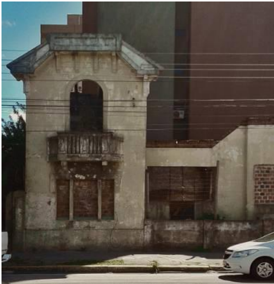
Figura 4 – Casarão em ruínas Fonte: Arquivo pessoal da autora, set. 2015.

isoladamente, pavimentação e as fachadas dos prédios). Um dos exemplos escolhidos foi anotado durante o percurso rumo à escola de Maria, realizado algumas vezes a pé. O casarão (Figura 4), situado na Rua Almirante Barroso, esquina com a Rua Sete de Setembro 8 , é um elemento que, devido ao seu estado de avançada deterioração, contrasta imediatamente com os prédios mais modernos ao redor. Ao notar que o casarão lhe atraía o olhar, perguntei sua opinião a respeito do que estava enxergando, respondendo-me que era “feio não cuidarem de um lugar que alguém usou...” (MARIA, 2015, informação verbal) 9 .