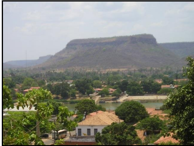
Figura 2 – Vista da Chapada de São Francisco do Maranhão (Cidade vizinha a Amarante-PI) juntamente com o rio Parnaíba.