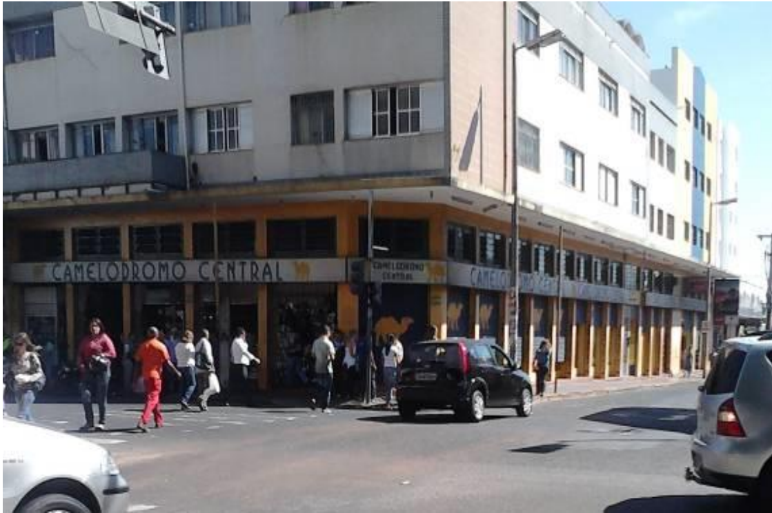
Figura 03 – Uberlândia: Camelódromo Central Fonte: Letícia Parreira Oliveira, 2013.

A importância da rede atacadista de Uberlândia não é apenas regional, uma vez que elas abastecem todo o país. Por sua localização estratégica entre os principais centros consumidores brasileiros: São Paulo, Rio de Janeiro, Belo Horizonte, Goiânia e Brasília, contando com mais de 60 milhões de consumidores em um raio de 600 km. As maiores empresas do país nesse ramo estão em Uberlândia: Martins Comércio e Serviço de Distribuição S/A (Figura 04), Arcom Comércio de Importações e Exportações Ltda., Peixoto Comércio, Indústria e Serviço de Distribuição Ltda.