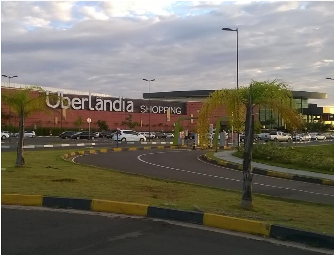
Figura 05 – Uberlândia Shopping.

Neste sentido, há uma reestruturação funcional do centro da cidade, implicando na totalidade urbana, onde se tem melhorias dos serviços de mobilidade urbana, através do alargamento das ruas e avenidas, possibilitando, assim, a ampliação dos limites urbanos.