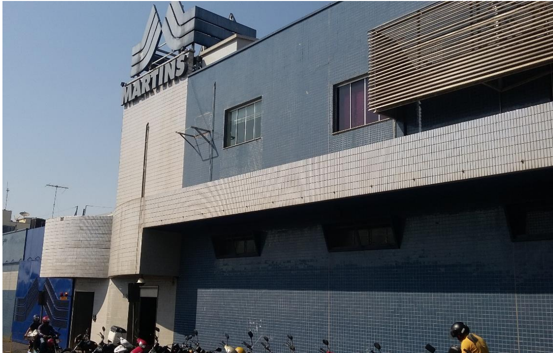
Figura 04 – Uberlândia: Martins

A Martins atende cerca de 376.000 clientes em todo o país, empregando mais de 4.730 funcionários (PORTAL MARTINS, 2015), com a receita de 4,7 bilhões em 2014 que significa a segunda maior receita do país no ramo de distribuição (REVISTA EXAME, 2015). Com o fluxo de transporte muito intenso, a cidade de Uberlândia é responsável por cerca de 58% dos alimentos industrializados, produtos de higiene, limpeza e perfumaria que circulam pelo interior do país, segundo Bessa (2007).