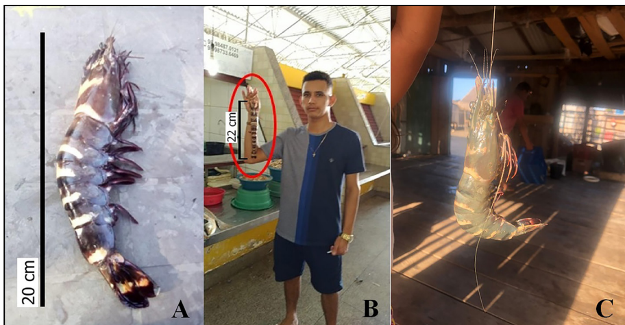
Figura 1. Exemplar da espécie invasora Penaeus monodon capturado no litoral estado do Maranhão. A - Praia de Parna-Açú, em São Luís; B - exemplar capturado no estuário do rio Guarapiranga, em Guimarães; C - Ilha da Baleia, Apicum-Açu.

A introdução de espécies não nativas também tem sido associada como a segunda maior causa de extinção de espécies nativas em