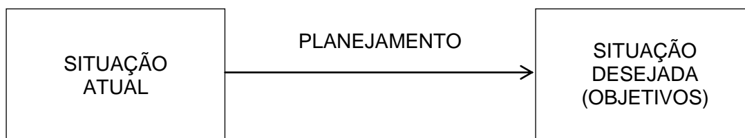
Figura 2 – Planejamento entre o presente e futuro.