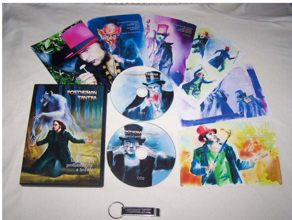
Figure 1: Posthuman Tantra – Ten years of Posthumanity Tribute (2014).