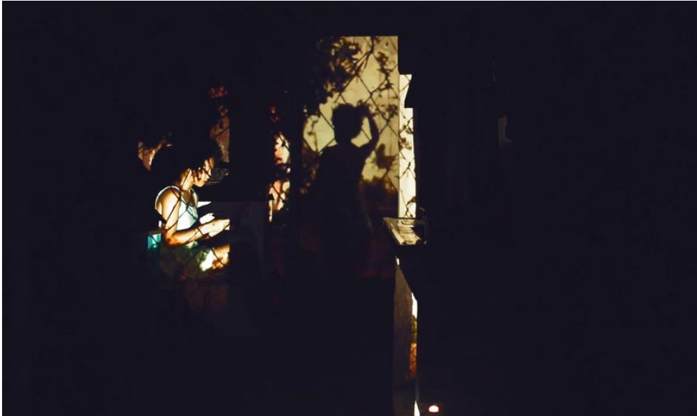
Vídeo-performance “18 de agosto”. Disponível em: https://vimeo.com/535976076 .