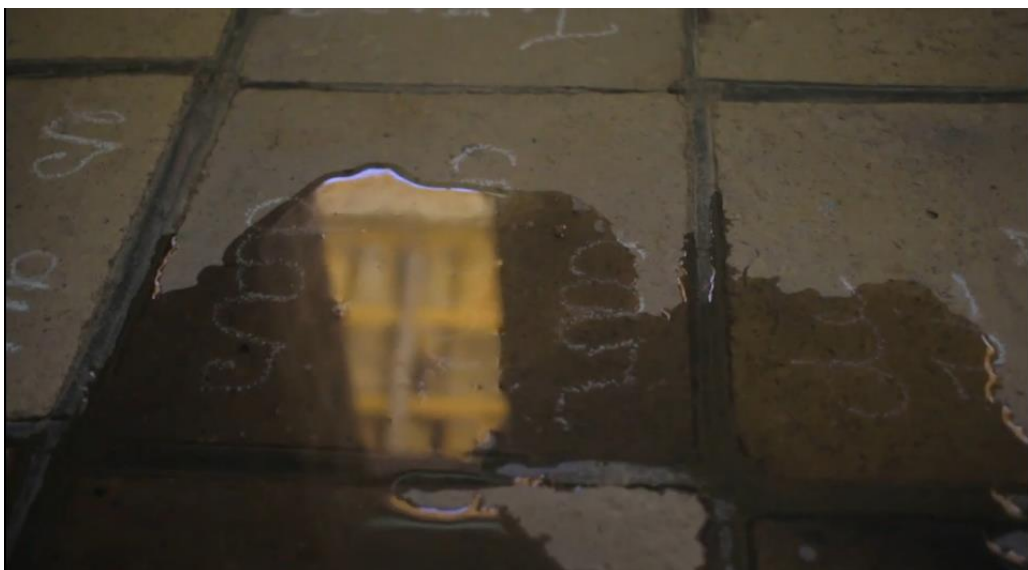
Vídeo-performance “23 de janeiro”. Disponível em: https://vimeo.com/535975720 .