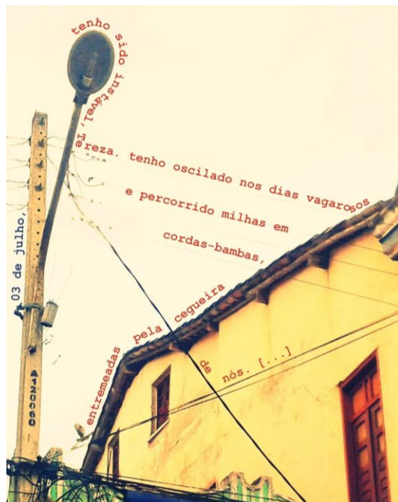
Imagem 1: Cartões postais a Tereza - 3 de julho 7

Desde o começo, a poeta hibridiza as linguagens artísticas. Nasceram assim, a performance A moça que desfiou 4 ; a videoarte Os dias circulares 5 ; a videocarta 23 de janeiro presente no projeto coletivo (auto)lou.cu.ra 6 ; o método de vivência artística denominado Erranciar e o uso da lomografia como processo capaz de capturar os momentos, as experiências de cada cidade visitada; a publicação de uma série de cartões postais, intitulada cartões-postais a Tereza/caixas de entrada , aliando texto e fotografia (imagem 1).