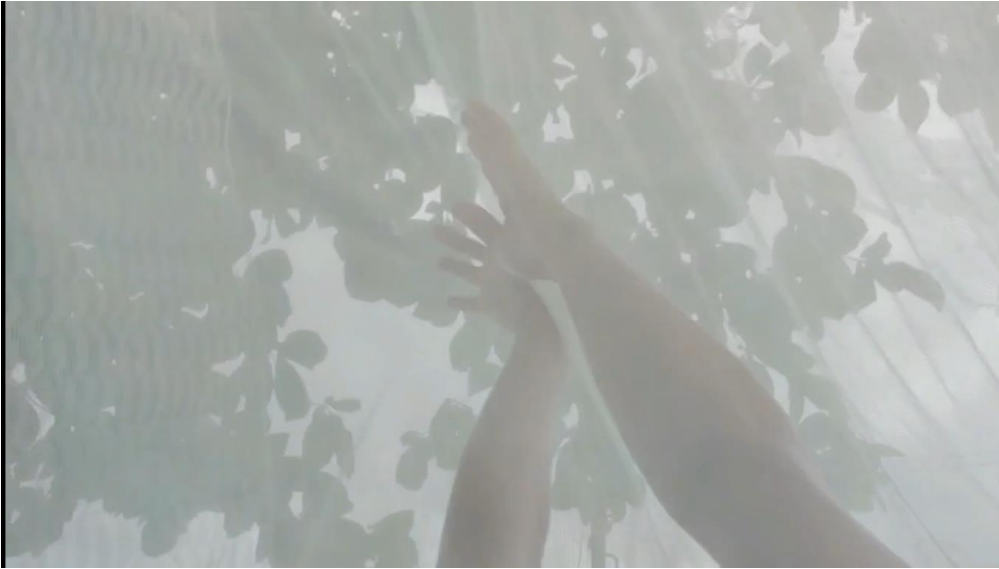
Vídeo-performance “18 de agosto”. Disponível em: https://vimeo.com/535976076 .